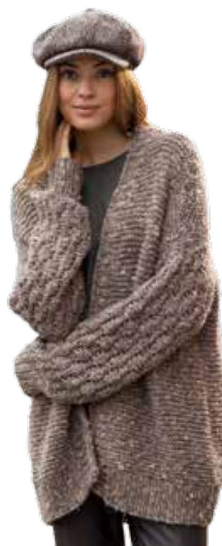
Bild aus Maschen-Style SC 005 Erschienen bei OZ-Verlag Fototeam: Peter Münnich