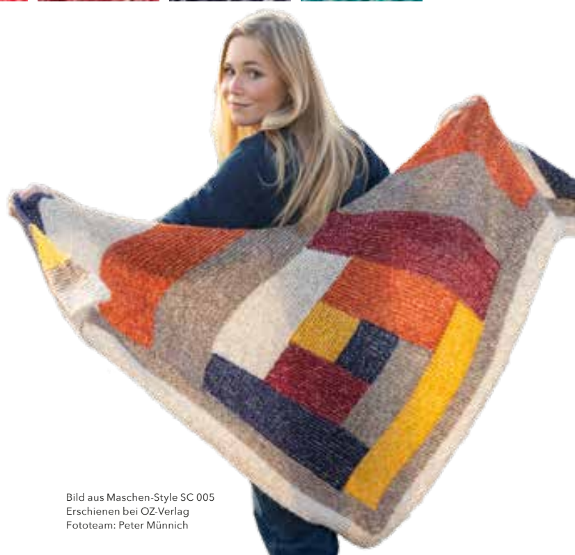
Bild aus Maschen-Style SC 005 Erschienen bei OZ-Verlag