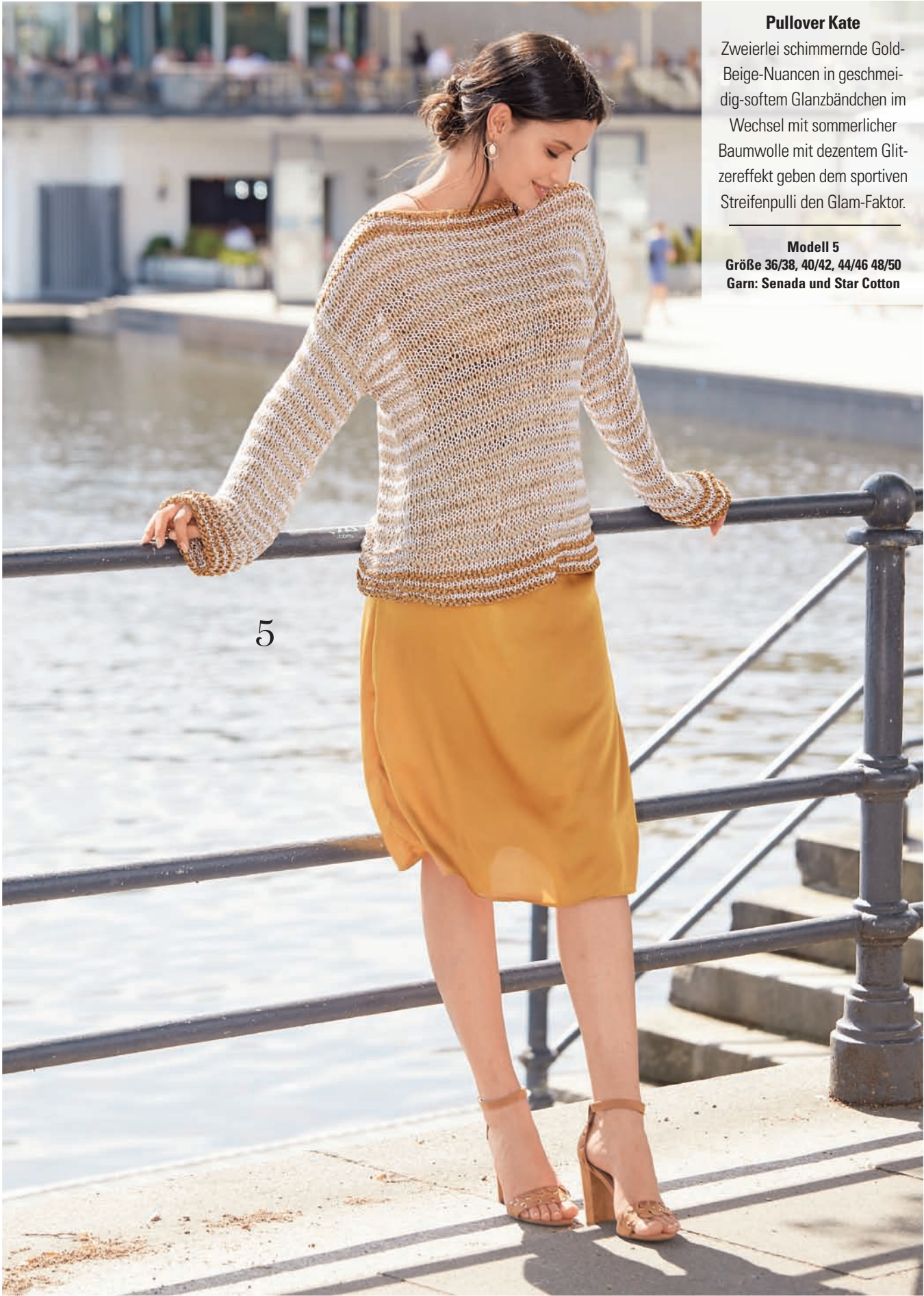
Pullover Kate Zweierlei schimmernde Gold- Beige-Nuancen in geschmei- dig-softem Glanzbändchen im Wechsel mit sommerlicher Baumwolle mit dezentem Glit- zereffekt geben dem sportiven Streifenpulli den Glam-Faktor. Modell 5 Größe 36/38, 40/42, 44/46 48/50 Garn: Senada und Star Cotton