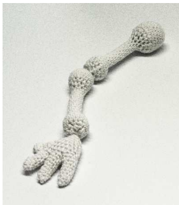
Oberarm, Unterarm und Hand an den Gelenkpunkten mit Stiel aneinander nähen, damit die Gelenke frei schwingen können.