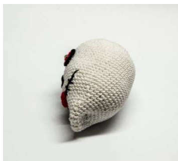
Kopf von der Seite gesehen