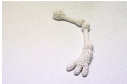
Ober-, Unterschenkel und Fuß

Nun das gesamte Skelett auf dem Tisch auslegen und die Glieder so zusammenlegen, wie es sein soll. Dann die Glieder an den Gelenkpunkten mit Stielstichen aneinandernähen, so dass alle Gelenke beweglich sind.