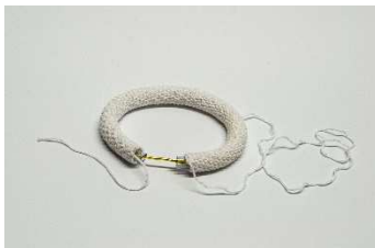
Rippenbogen mit eingeführtem Schlauch und Draht