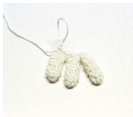
3 Finger miteinander verbunden

Die 2. Hand gegengleich arbeiten, beide Hände ausstopfen und die Öffnung schließen, indem der Endfaden durch alle vorderen Maschenglieder gezogen wird.