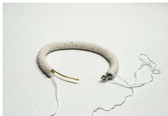
Rippenbogen mit eingeführtem Schlauch und Draht

Mit weiß 9 LM häkeln und zur Runde schließen. Mit f M weiter in Runden häkeln, bis ein ca. 26 cm langer Schlauch entsteht. Einen ebenso langen Schlauch (0,8 cm Durchmesser) einführen, in den Schlauch noch ein ca. 36 cm langes Stück Draht einsetzen. Den Schlauch zur Runde schließen und zusammennähen.