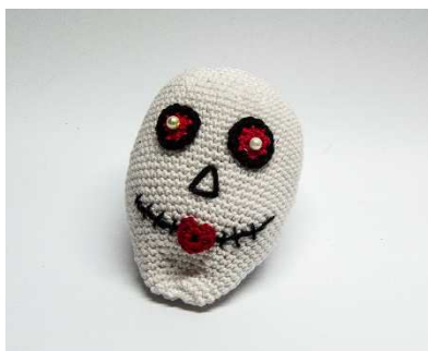
Kopf mit bestickter Nase und Mund

Mund und Nase auf den Kopf (siehe Foto) sticken. Auf die Linie des gestickten Mundes das Herzchen als Kussmund aufsetzen.