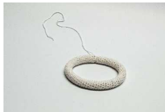
Rippenbogen zur Runde geschlossen

Die Wirbelsäule durch die 3 Rippenringe führen und in gleichmäßigem Abstand Voneinander an der Wirbelsäulenrückseite befestigen. Den Schultergürtel auf der oberen Wirbelsäulenöffnung befestigen. Auf der gleichen fortlaufenden Achse zur Wirbelsäule den Hals auf den Schultergürtel setzen, darauf dann den Kopf.