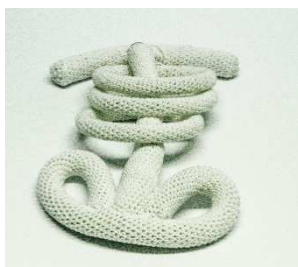
Wirbelsäule/Becken mit Rippenringen und Schultergürtel

Die Wirbelsäule durch die 3 Rippenringe führen und in gleichmäßigem Abstand Voneinander an der Wirbelsäulenrückseite befestigen. Den Schultergürtel auf der oberen Wirbelsäulenöffnung befestigen. Auf der gleichen fortlaufenden Achse zur Wirbelsäule den Hals auf den Schultergürtel setzen, darauf dann den Kopf.