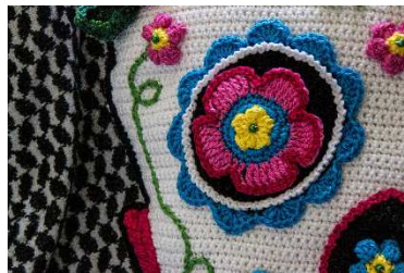
fertige Blüte mit Perle