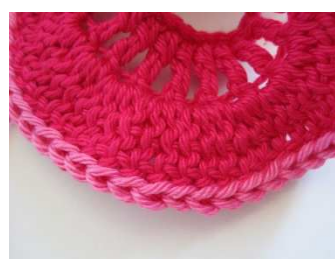
Kettmaschen in pink