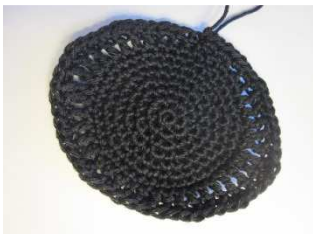
1. - 10. Rd.