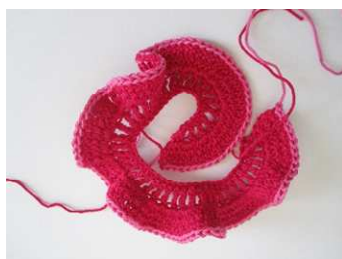
4. Reihe: 1 R Kettmaschen