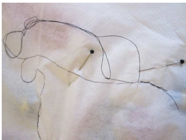
Linie mit Nähgarn nachstickern. Danach die Serviette entfernen