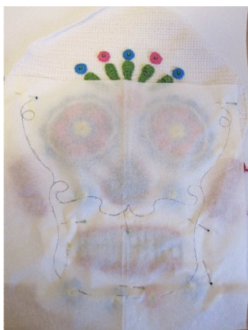
Serviette mit aufgemalten Deko-Linien zum Nachstickern