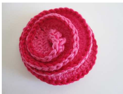
Rose als Spirale gegen den Uhrzeigersinn aufdrehen und befestigen