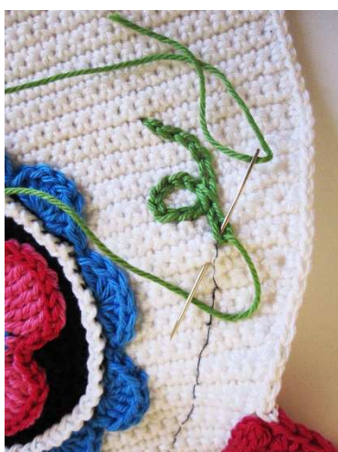
Zarte Sticklinie mit Kettstich nachstickern

Beide Kissenplatten nun mit schwarz in f M zusammenhäkeln, dabei am oberen Kopf etwas offenlassen, um das Kissen mit Füllwatte gut auszustopfen.