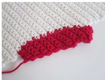
cyclam-farbenes Ohr in Intarsientechnik

58. R: nur im weißen Bereich weiter häkeln, mit weiß: 2 f M in 1 M, 68 f M, 2 f M in 1 M