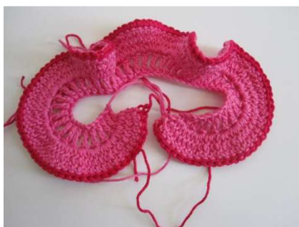
Rose in pink, Rand in cyclam