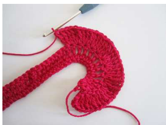
3. Reihe: 3 Doppel-Stb in jede M der Vorreihe

Ausarbeiten: Die Zunahmekante auseinanderziehen (= 3. R) und vorsichtig bügeln. Die LM-Kante gegen den Uhrzeigersinn drehen, mit der 1. R und mit dem langen Anfangsfaden dabei nähen. Wenn die Spirale fertig gedreht ist, das Garnende der 4. R fassen und durch den Mittelteil der Rose stechen.