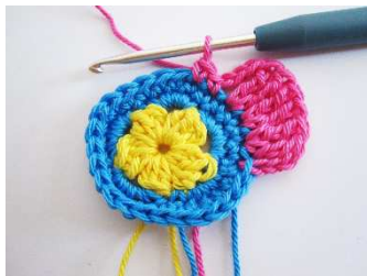
Runde 4, Blütenblätter