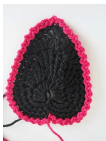
Nasenloch mit cyclamfarbener Kante