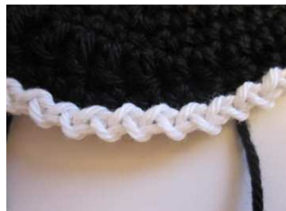
11. Rd. in weiß