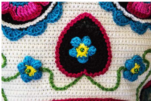
Kleine Blumen in Fb karibik

In die Mitte der Blumen jeweils 1 Perle setzen.