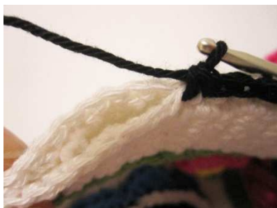
Kissenplatten mit fM zusammenhäkeln

Beide Kissenplatten nun mit schwarz in f M zusammenhäkeln, dabei am oberen Kopf etwas offenlassen, um das Kissen mit Füllwatte gut auszustopfen.