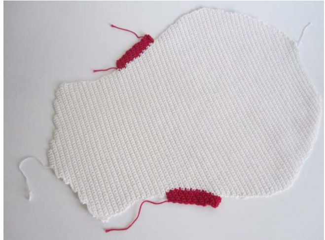
1 Kissen Seite

Jede Kissen Seite farblich angepaßt mit f M umhäkeln (cyclam an den Ohren, an allen anderen Stellen in weiß. Die 2. Kissen Seite und Dekoration gegengleich arbeiten.