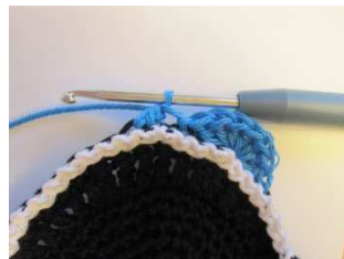
12. Rd. in blau