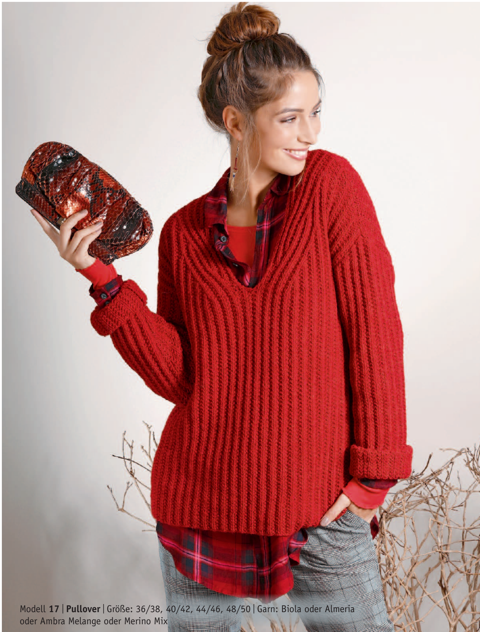
Modell 17 | Pullover | Größe: 36/38, 40/42, 44/46, 48/50 | Garn: Biola oder Almeria oder Ambra Melange oder Merino Mix