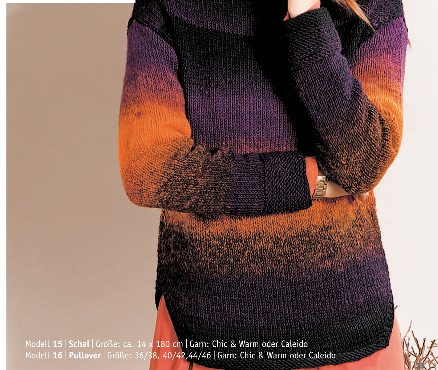
Modell 15 | Schal | Größe: ca. 14 x 180 cm | Garn: Chic & Warm oder Caleido Modell 16 | Pullover | Größe: 36/38, 40/42, 44/46 | Garn: Chic & Warm oder Caleido