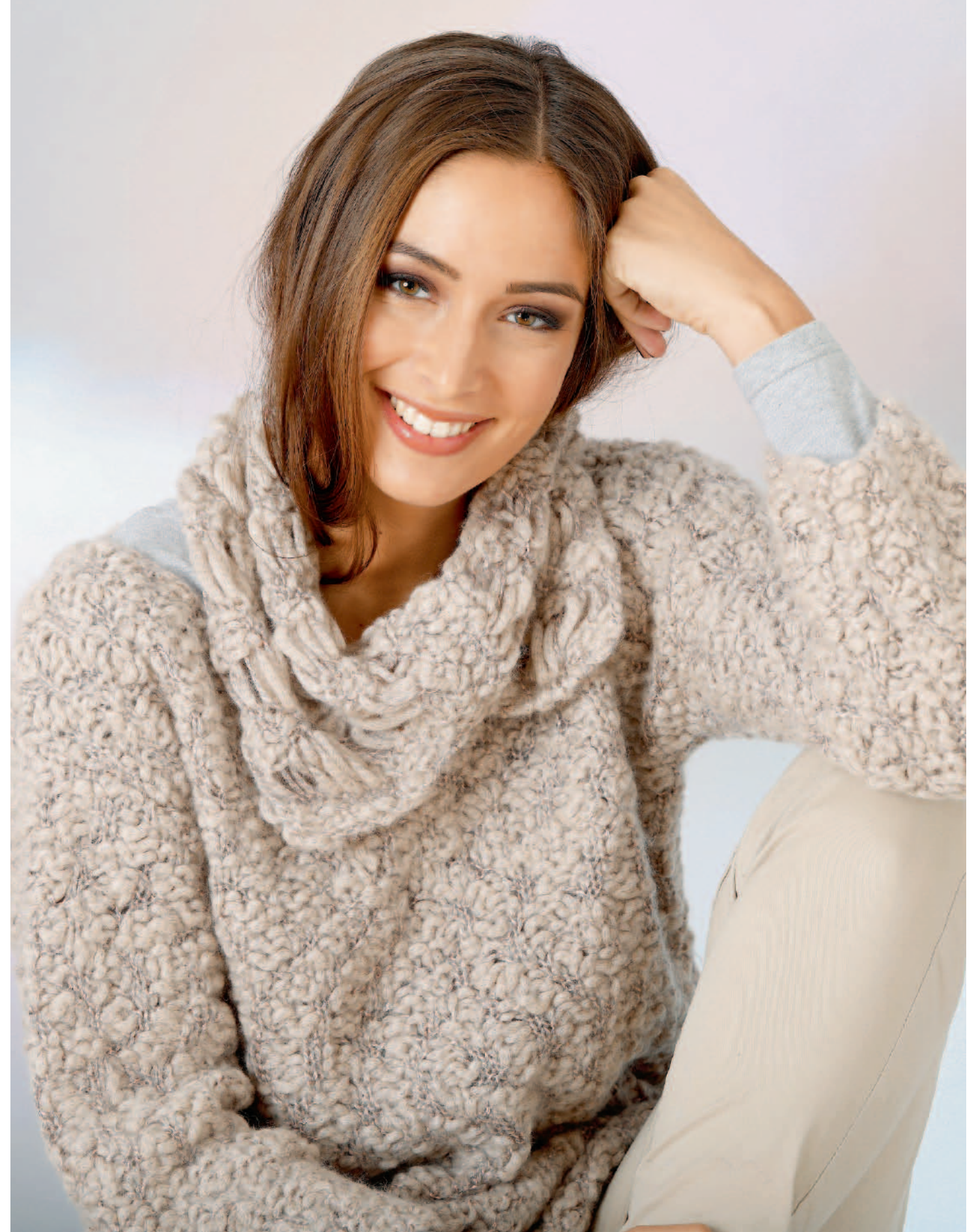
Modell 9 | Pulli | Größe: 36/38, 40/42, 44/46 | Garn: Big Flame Modell 10 | Loop | Größe: Umfang ca. 60 cm | Garn: Big Flame