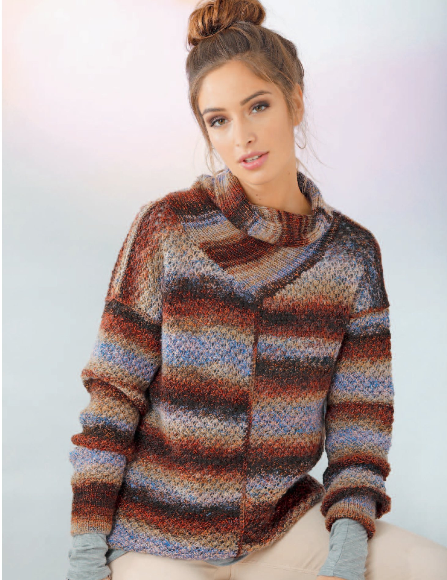
Modell 11 | Pullover | Größe: 36/38, 40/42, 44/46, 48/50 | Garn: Mia Bella Modell 12 | Longjacke | Größe: 36/38, 40/42, 44/46 | Garn: Big Flame