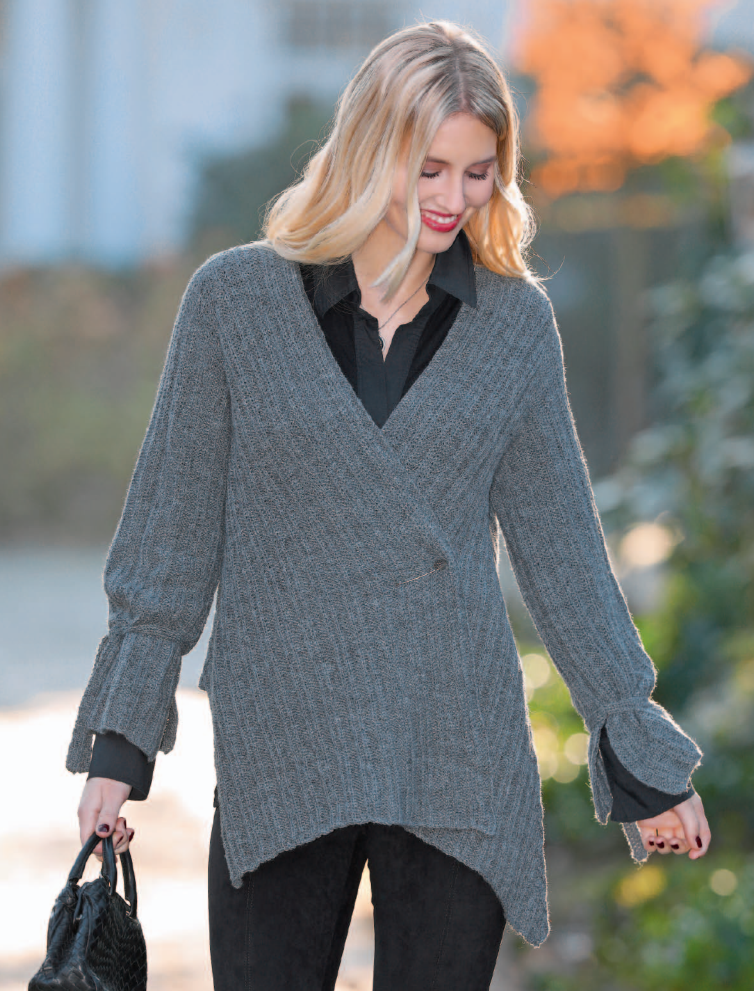
Modell 23 | Jacke | Größe: 38/40 | Garn: Step