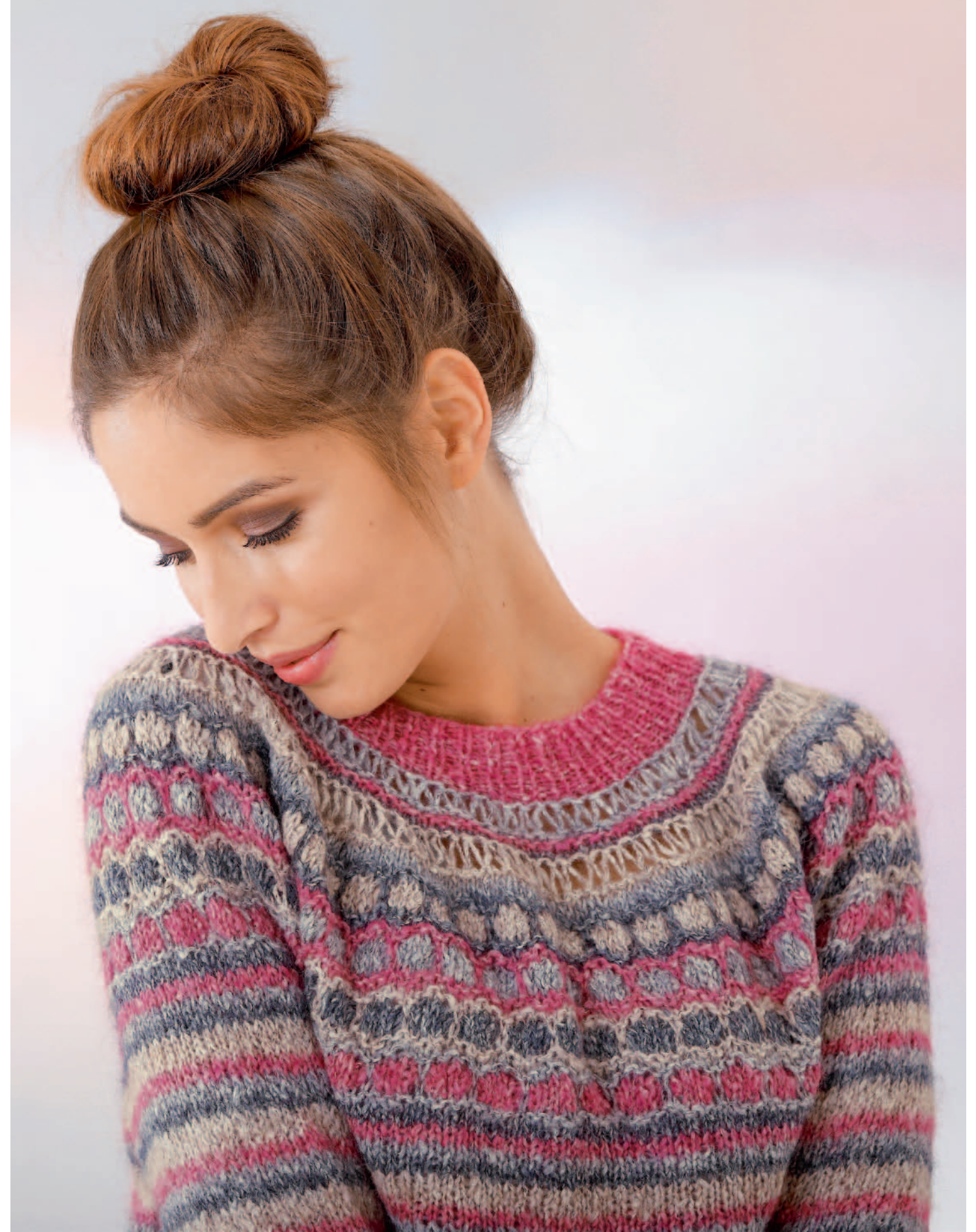
Modell 5 | Pullover | Größe: 36/38, 40/42 | Garn: Mohair Dream