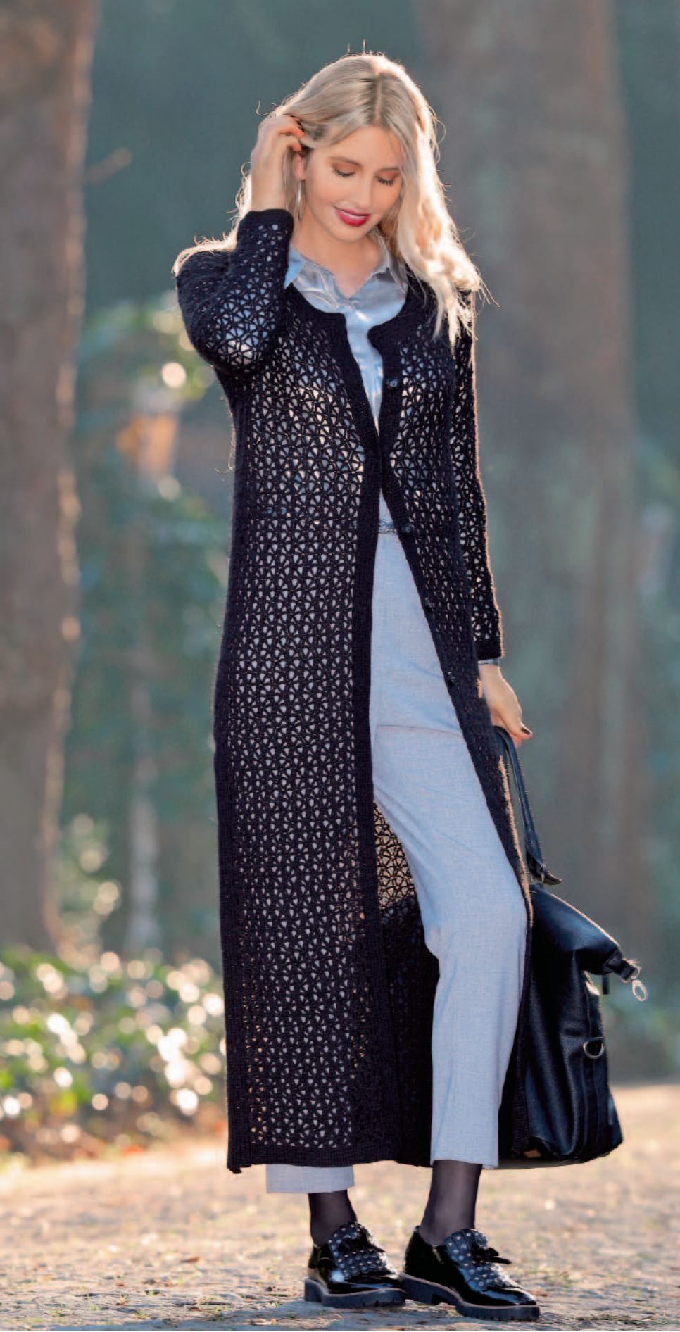
Modell 22 | Mantel | Größe:36, 38/40, 42, 44/46, 48 | Garn:Step Classic