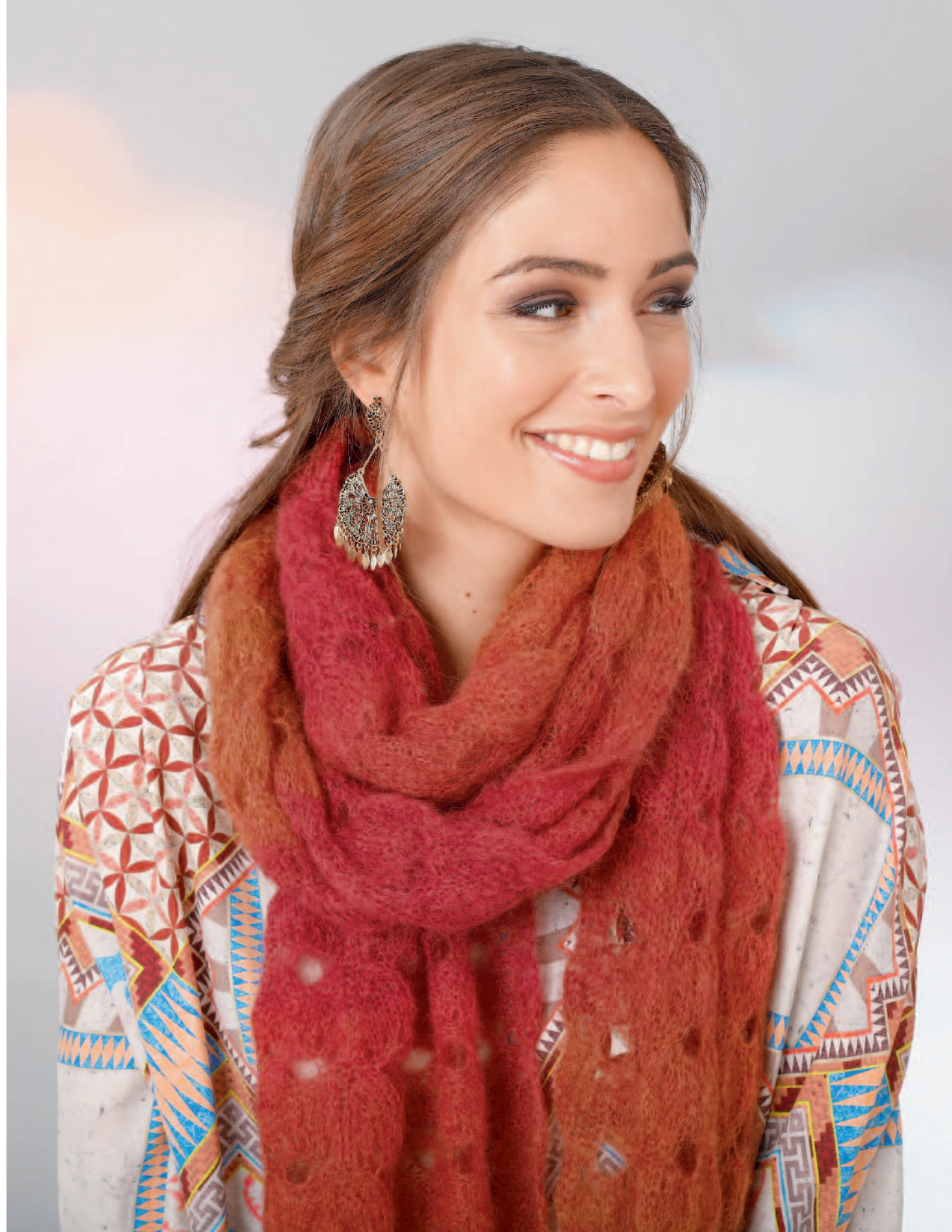
Modell 6 | Schal | Größe: ca. 35 x 240 cm | Garn: Kid Silk Degradé