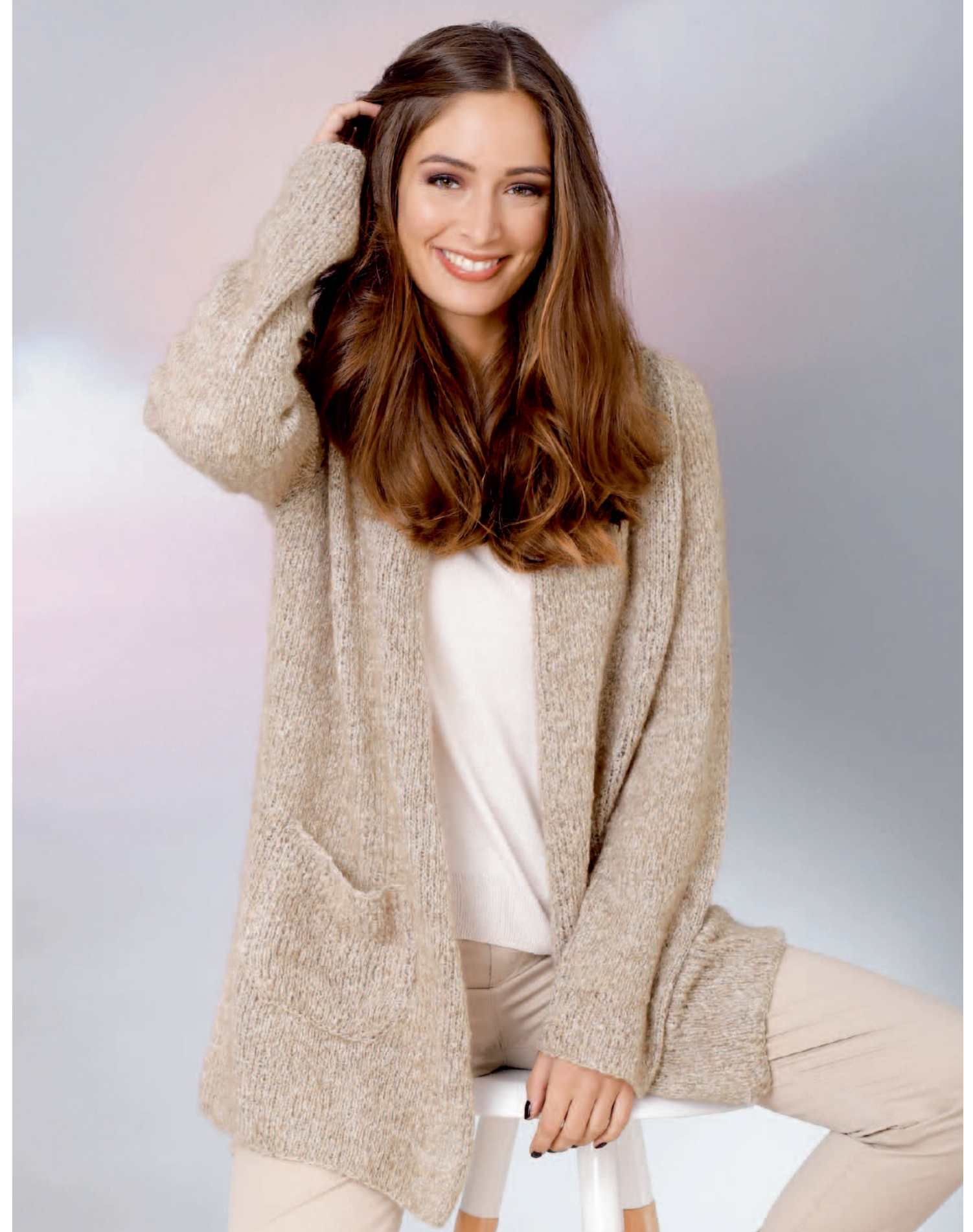
Modell 4 | Jacke | Größe: 36, 38/40, 42, 44/46, 48 | Garn: Mohair Dream oder Alpaca Star