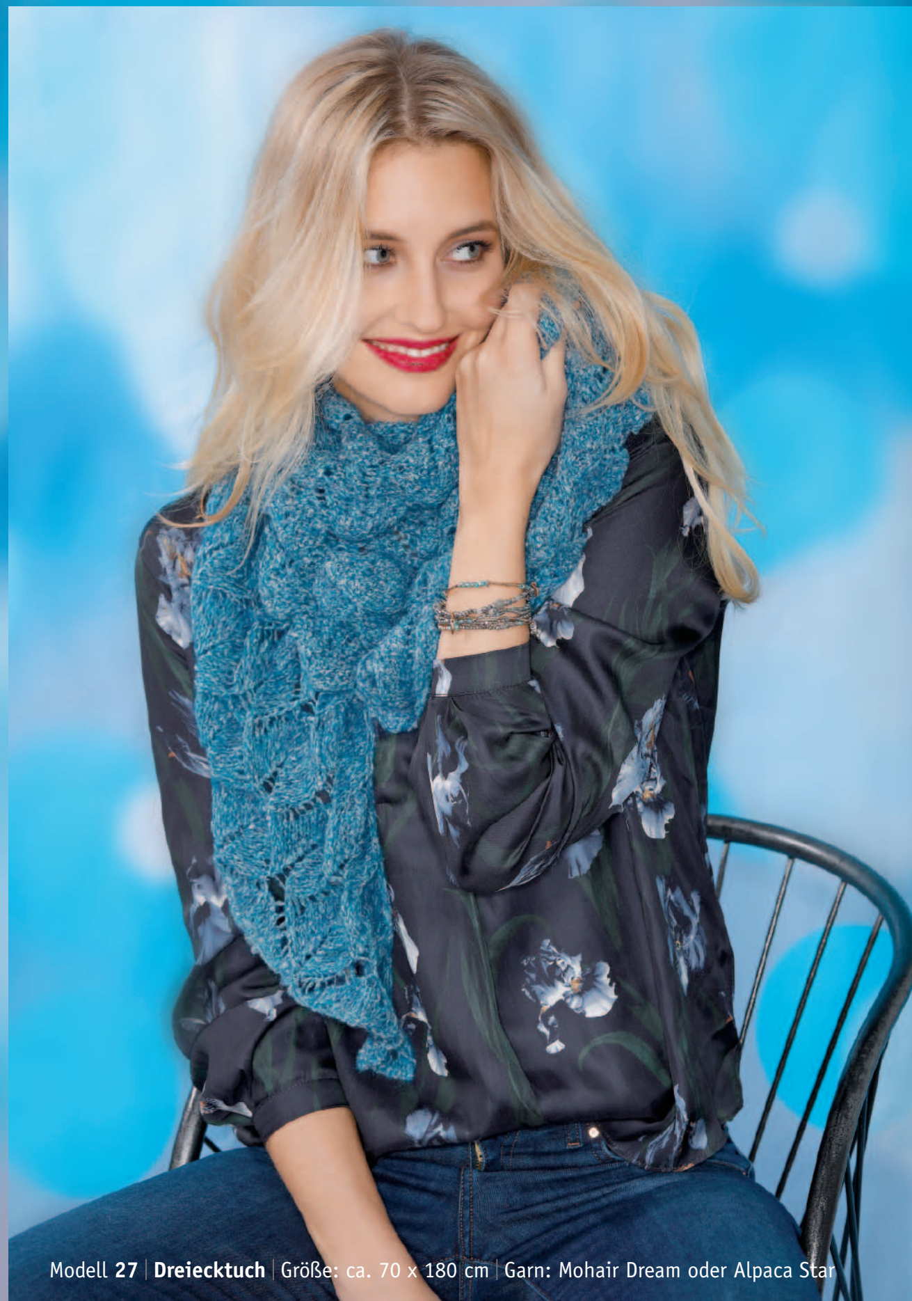
Modell 27 | Dreiecktuch | Größe: ca. 70 x 180 cm | Garn: Mohair Dream oder Alpaca Star