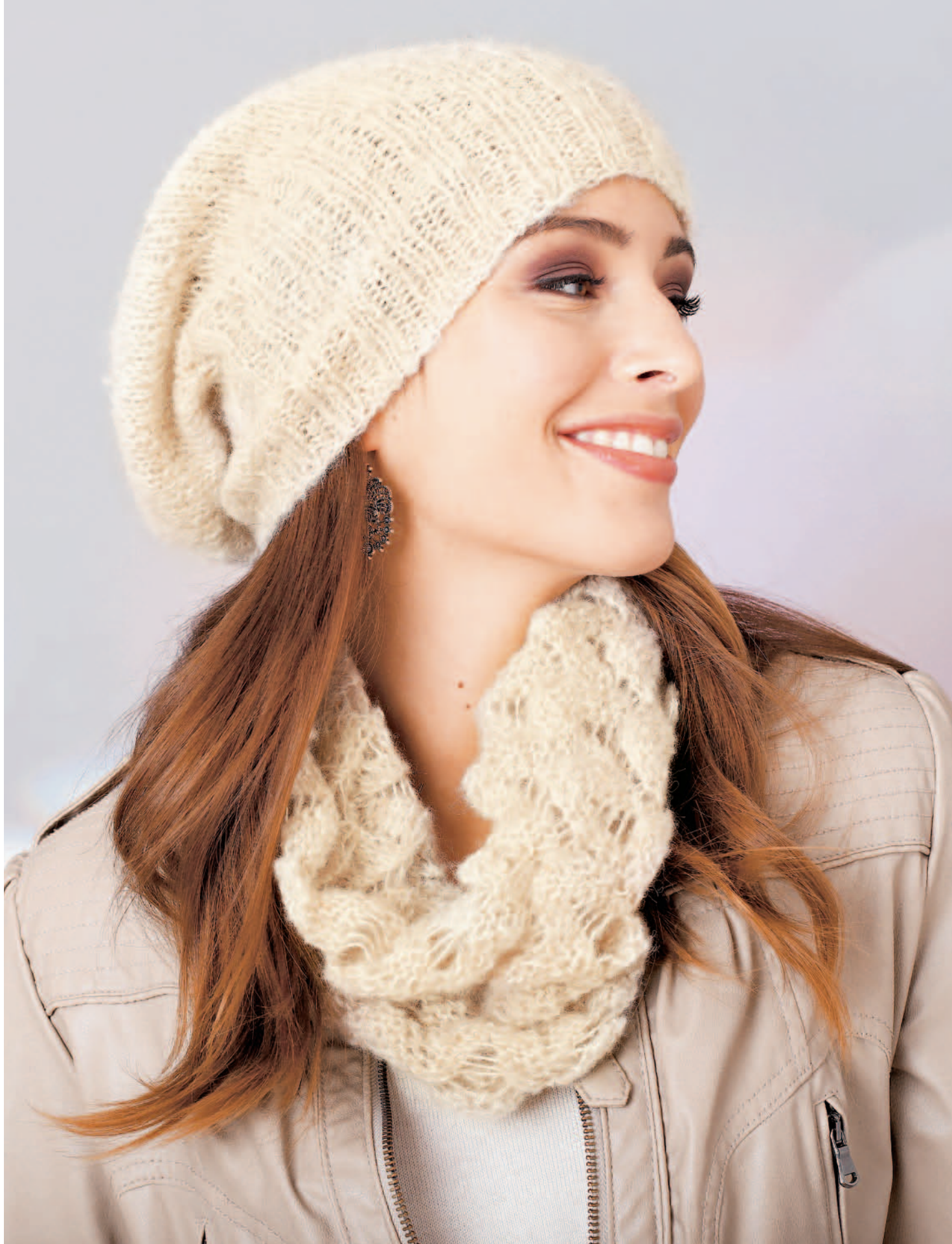
Modell 1 | Jacke | Größe: 36/38, 40, 42/44, 46, 48/50 | Alpaca Star oder Mohair Dream Modell 2 | Mütze | Größe: für Kopfumfang 54–56 cm | Garn: Alpaca Star oder Mohair Dream Modell 3 | Loop | Größe: Umfang ca. 60 cm | Garn: Alpaca Star oder Mohair Dream