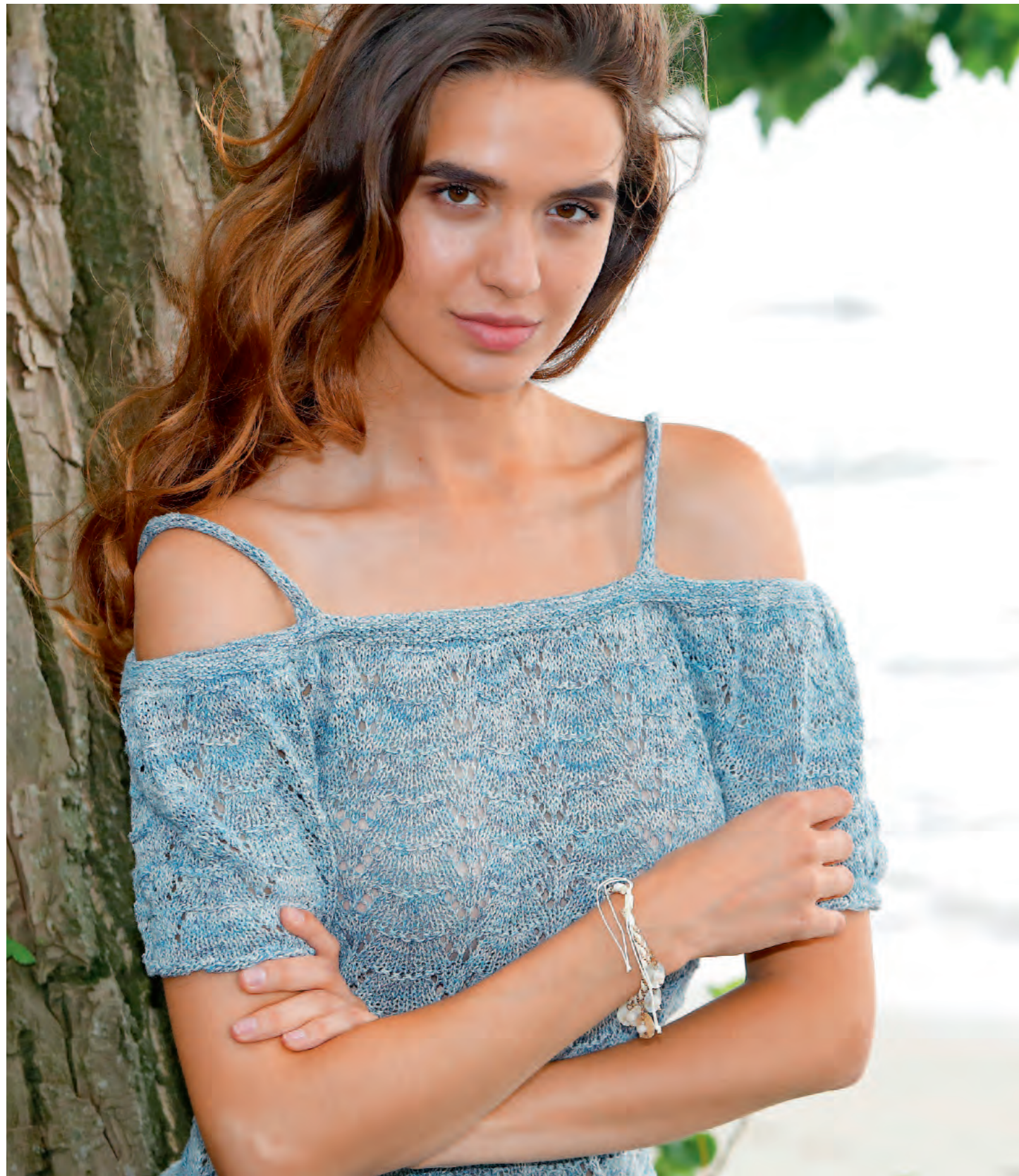
Modell 3 | Top | Größe 36, 40, 44 | Garn: Magic Silk Color