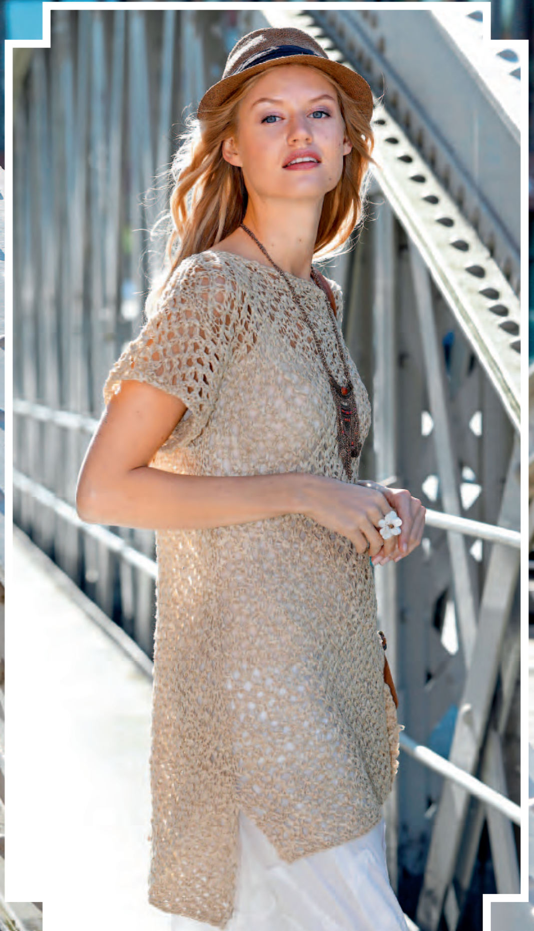
Modell 18 | Tunika | Größe 36, 38/40, 42, 44/46, 48/50 | Garn: Skye