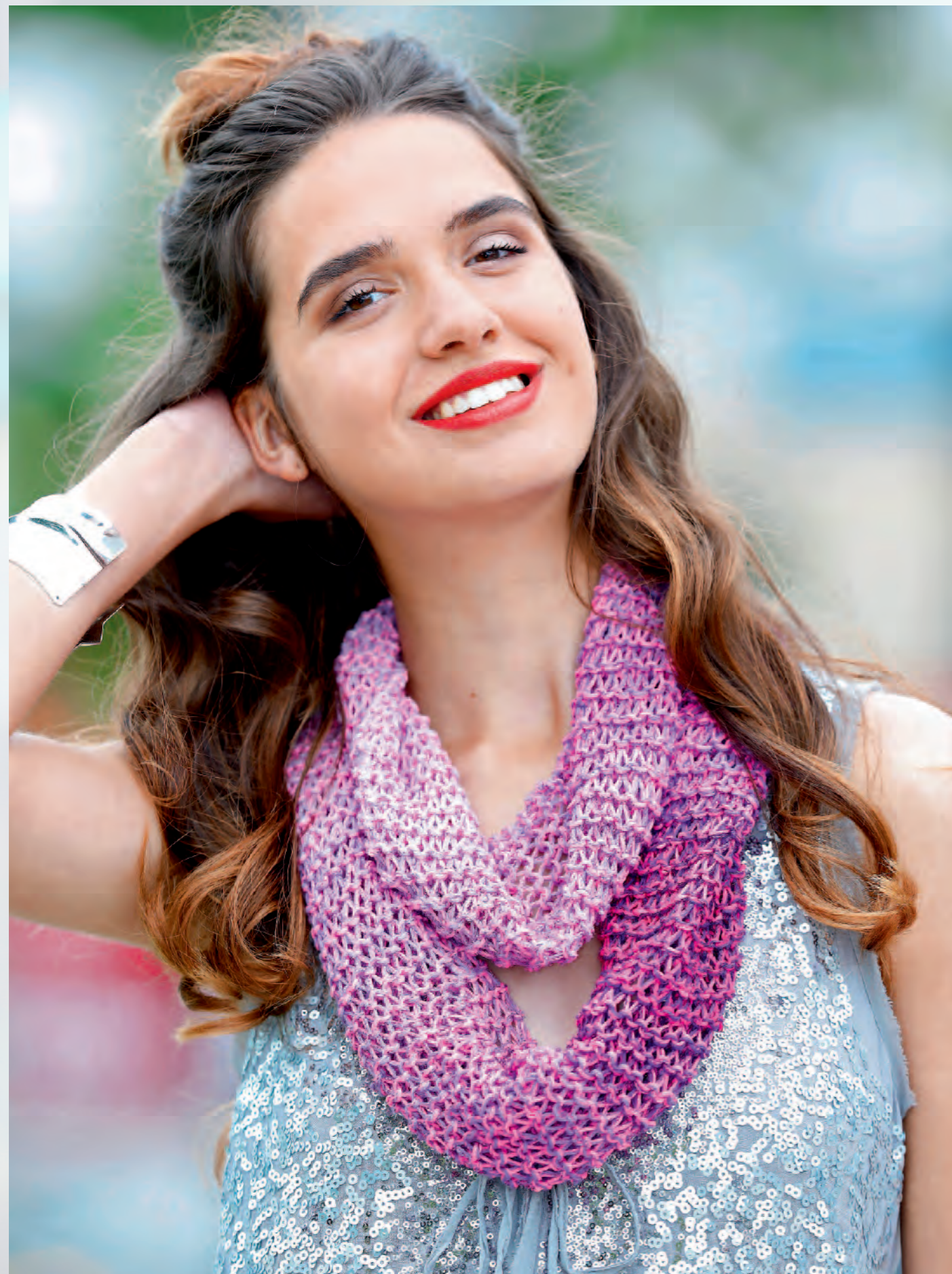
Modell 14 | Top und Loop | Größe 36/38, 40/42, 44/46 | Garn: Kendy