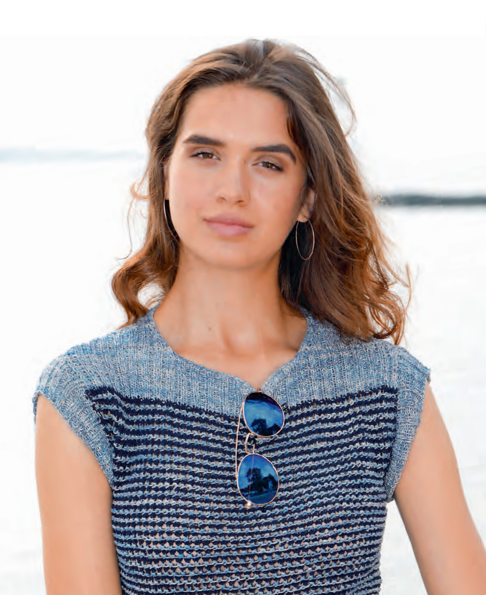
Modell 5 | Pulli | Größe 36, 38/40, 42, 44/46 | Garn: Magic Silk Color und Magic Silk