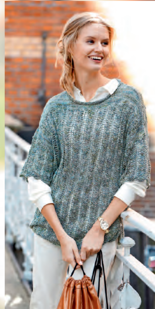
Modell 21 | Pulli | Größe 36/38, 40/42, 44/46 | Garn: Magic Silk Color