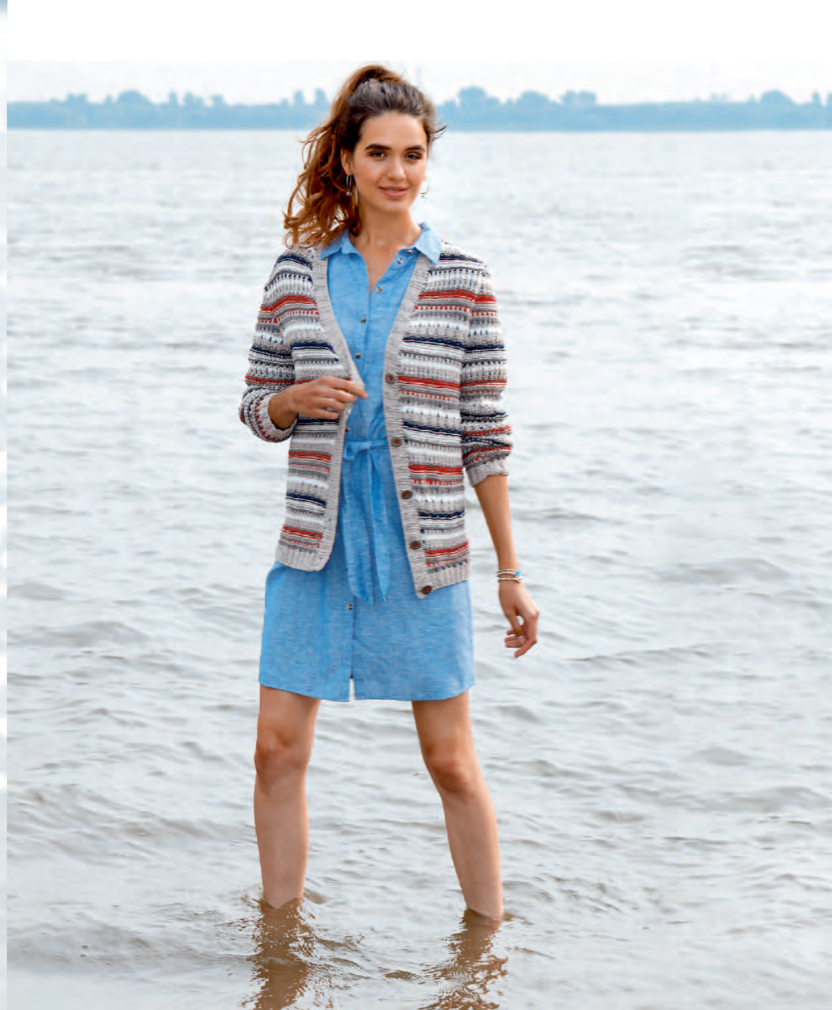
Modell 4 | Jacke | Größe 36, 38/40, 42, 44/46 | Garn: Pure oder Ajman oder Josy