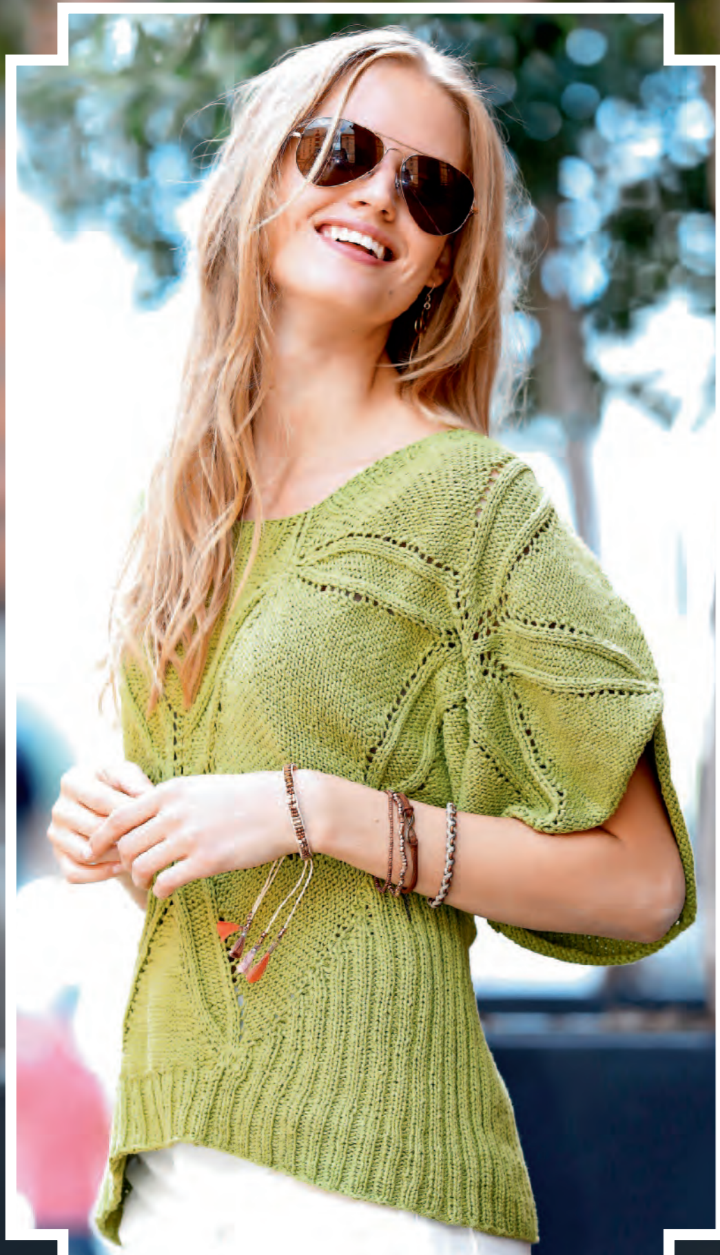
Uhr und Armband: Bijou Brigitte

Modell 19 | Pulli | Größe 36/38, 40/42, 44/46 | Garn: Pure oder Ajman oder Josy