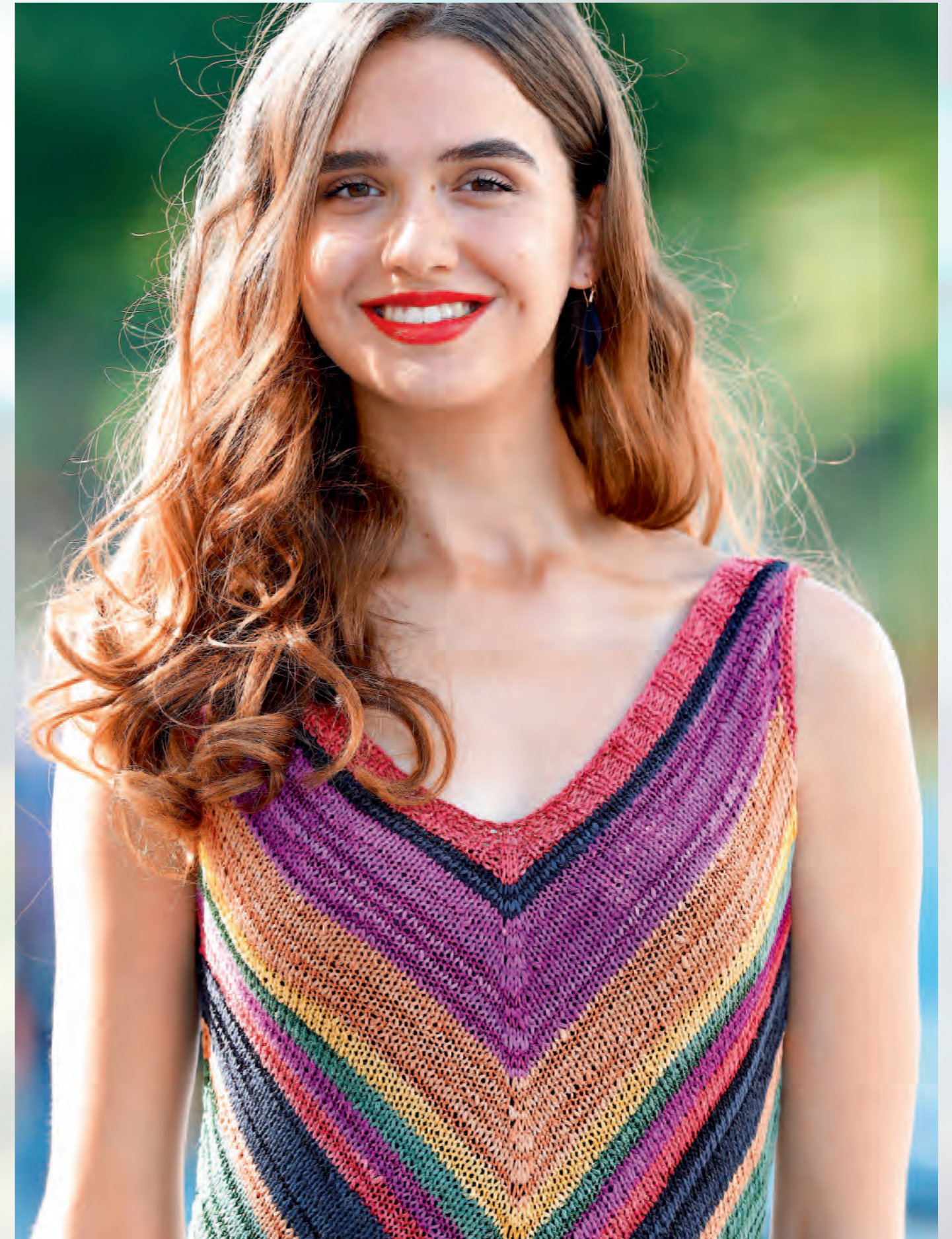
Modell 17 | Kleid | Größe 36/38, 40/42 | Garn: Shalima oder Limone