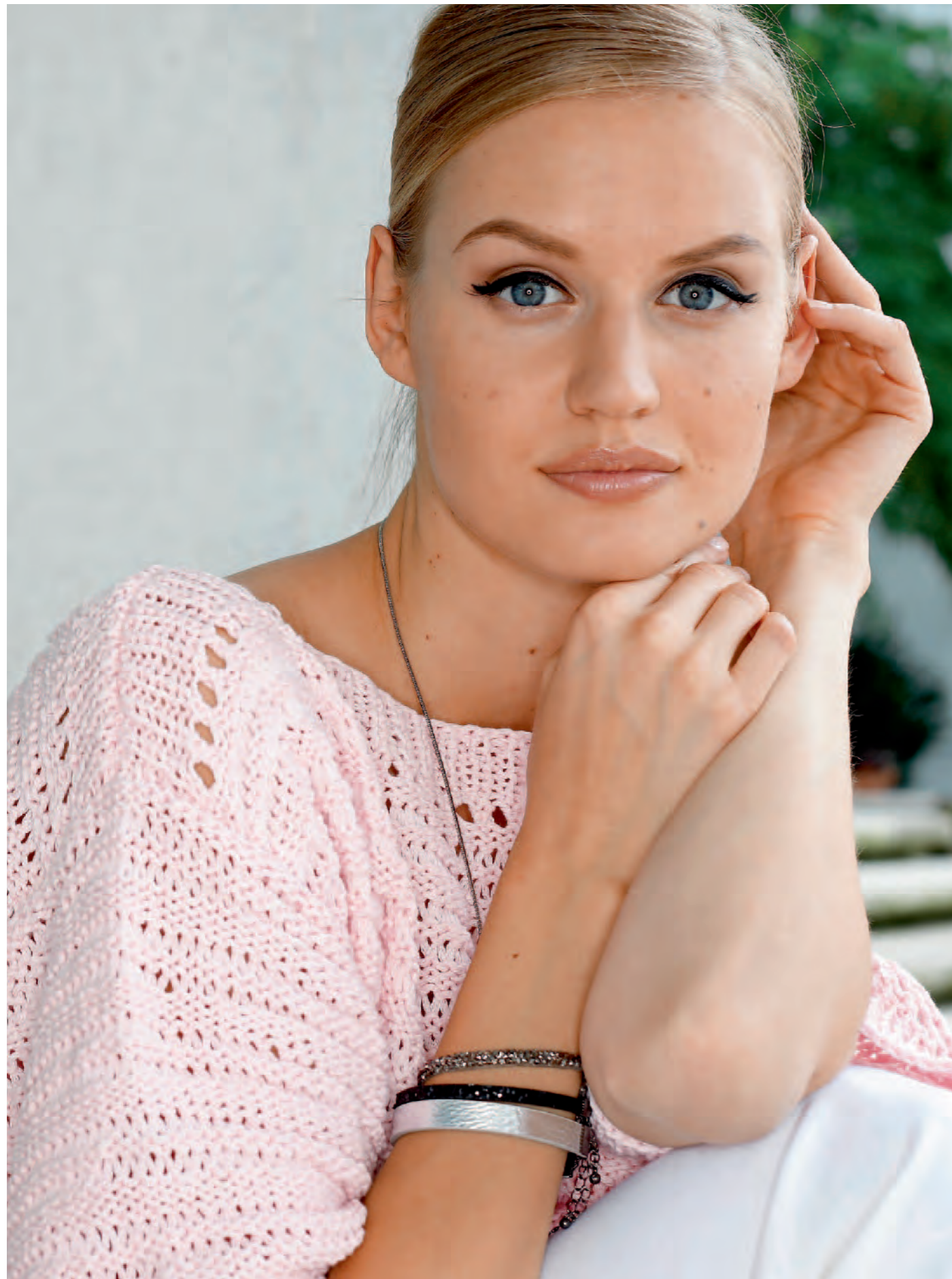
Modell 11 | Pulli | Größe 36/38, 40/42, 44/46 | Garn: Pure oder Ajman oder Josy