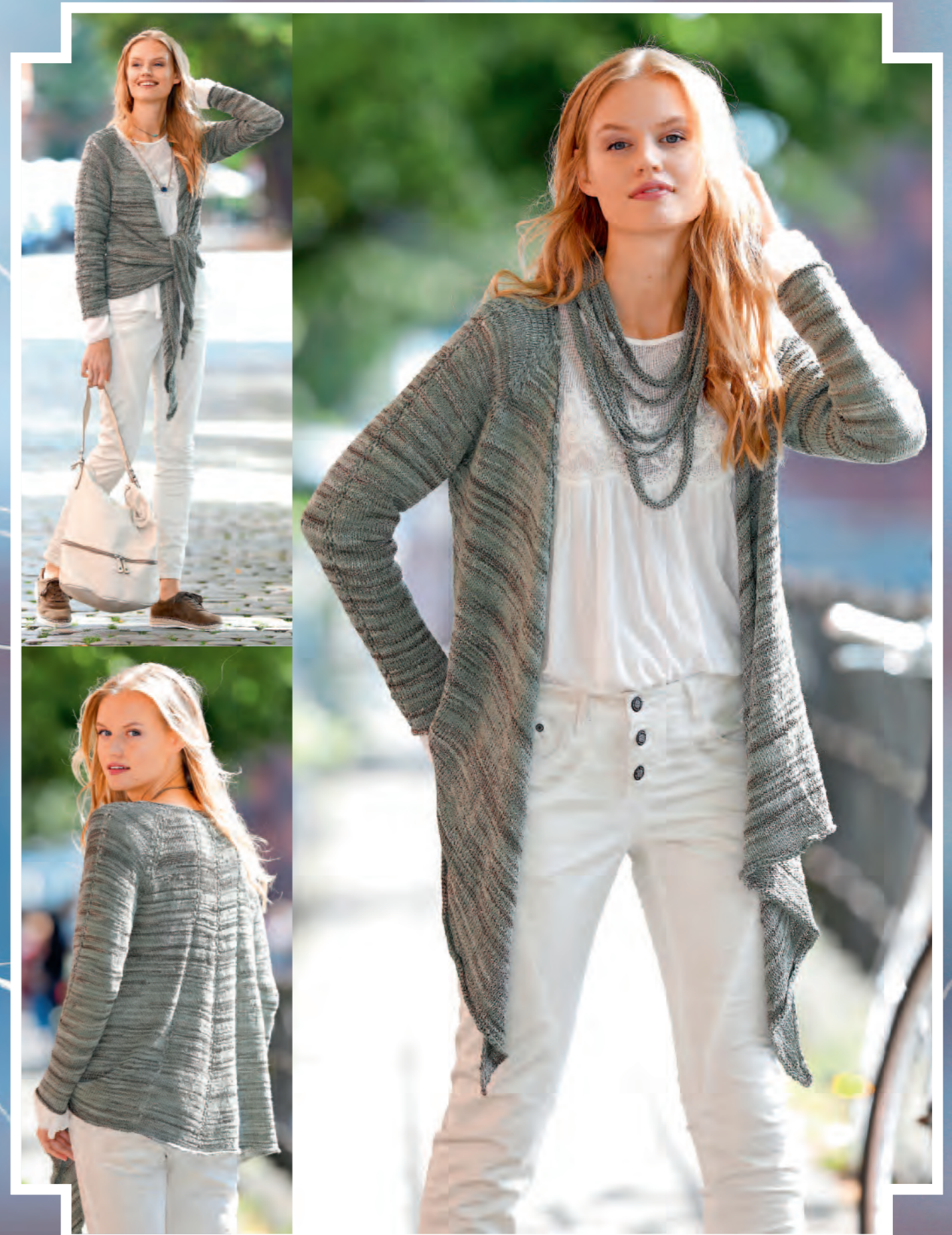
Modell 24 | Jacke und Kette | Größe 36/38, 40/42, 44/46 | Garn: Shalima oder Limone oder Satin Cotton