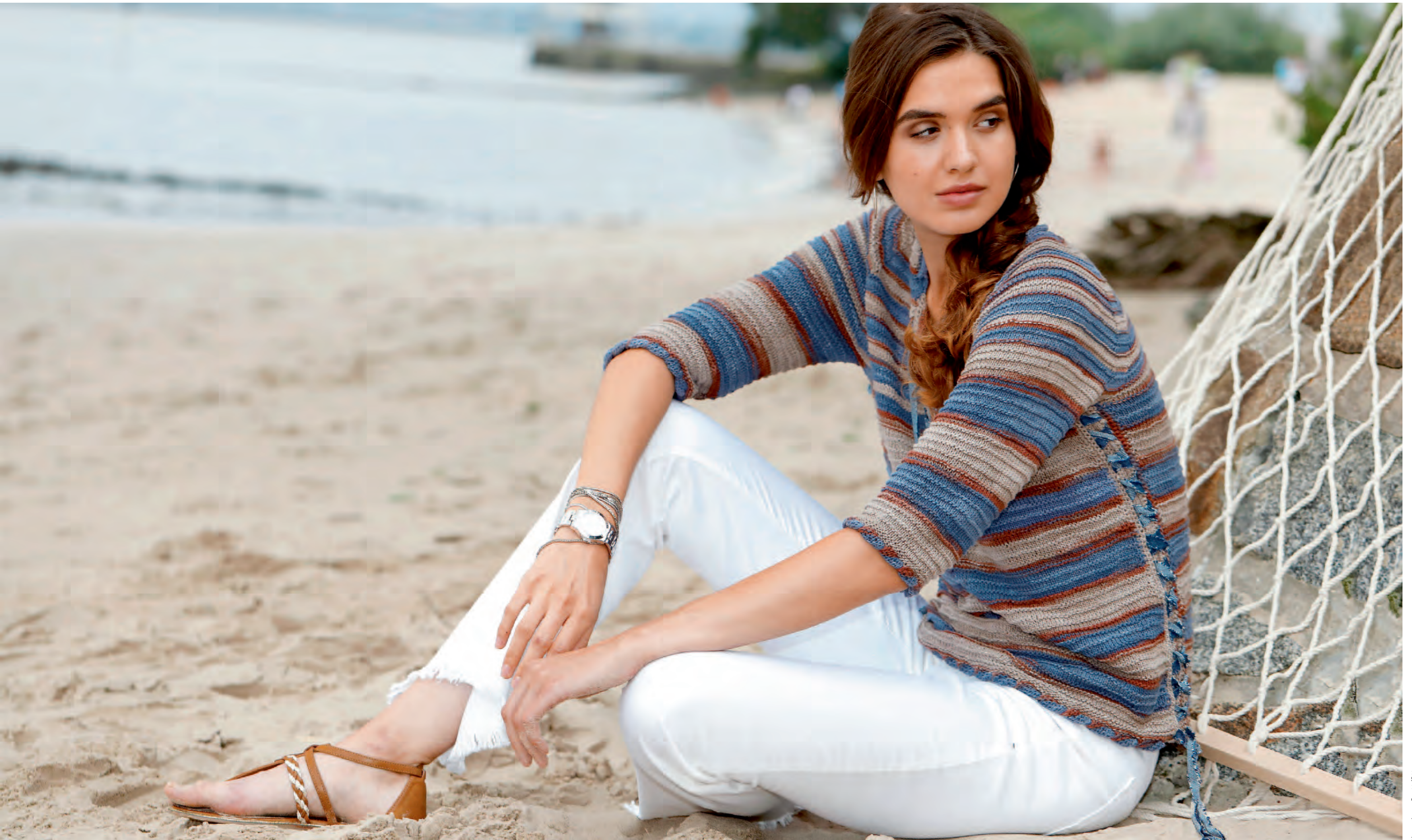
Modell 2 | Pulli | Größe 36, 38/40, 42 | Garn: Bio Cotton Color