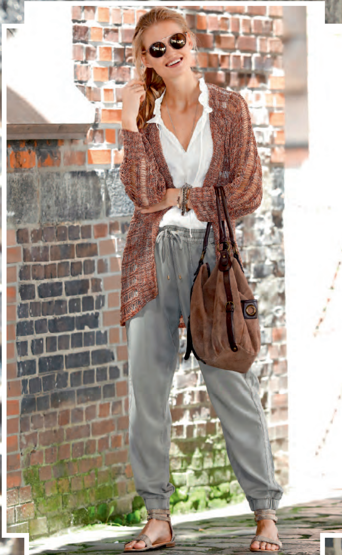
Modell 22 | Jacke | Größe 36, 38/40, 42, 44/46, 48 | Garn: Magic Silk Color