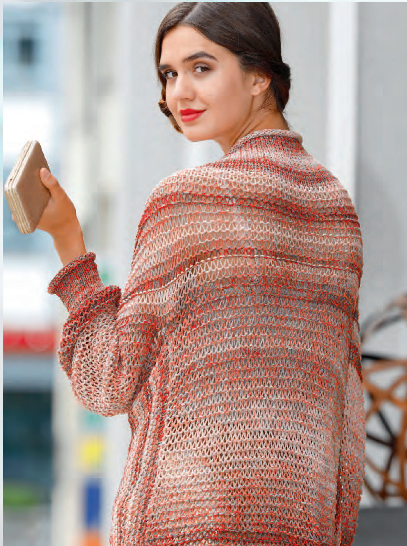
Modell 16 | Jacke | Größe Größe 38, 42, 46 | Garn: Kendy