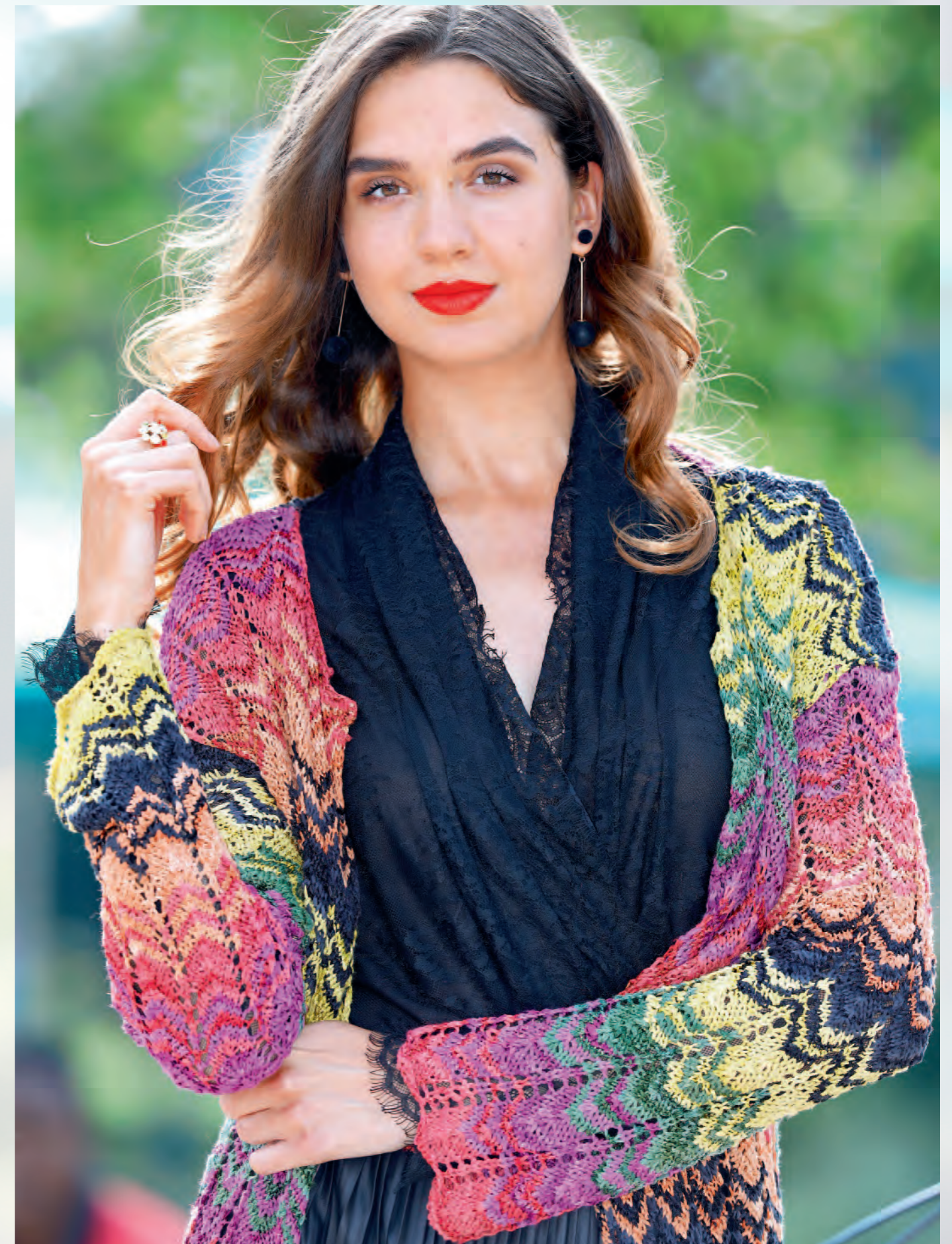
Modell 13 | Mantel | Größe 36, 40, 44 | Garn: Shalima oder Limone