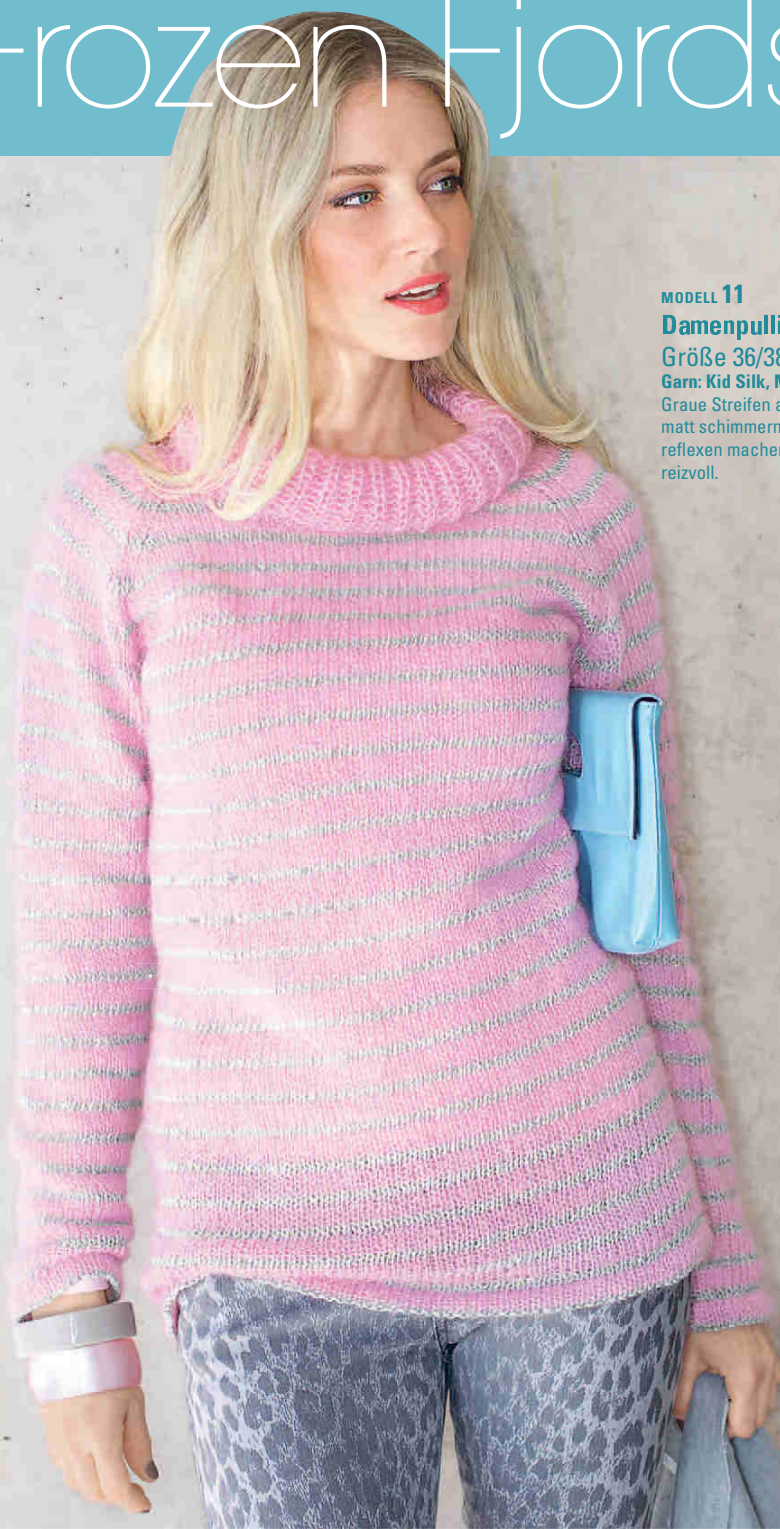
MODELL 11 Damenpulli Größe 36/38, 42, 44/46 Garn: Kid Silk, Marrakesch Graue Streifen aus Garn mit matt schimmernden Paillettenreflexen machen diesen Pulli reizvoll.

LICHT UND GLANZ IN GRAUE TAGE Eisige Pastellfarben in zarten Abstufungen erinnern an gefrorene Landschaften.