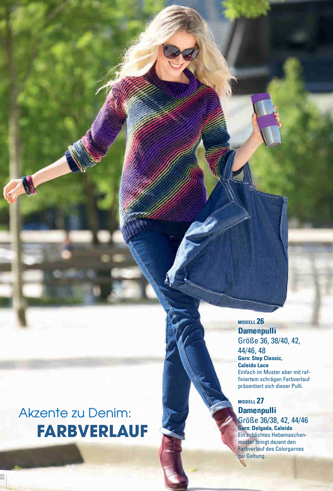
MODELL 26 Damenpulli Größe 36, 38/40, 42, 44/46, 48 Garn: Step Classic, Caleido Lace Einfach im Muster aber mit raf- finiertem schrägen Farbverlauf präsentiert sich dieser Pulli.