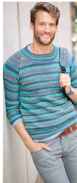
FARBE FÜR DEN HERRN