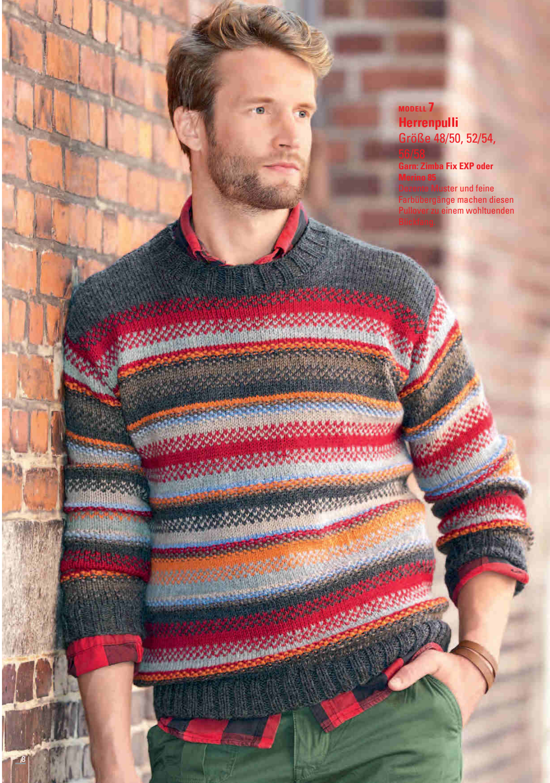
MODELL 7 Herrenpulli Größe 48/50, 52/54, 56/58 Garn: Zimba Fix EXP oder Merino 85 Dazwischen Muster und feine Farbübergänge machen diesen Pullover zu einem wohltuenden Blickfang.