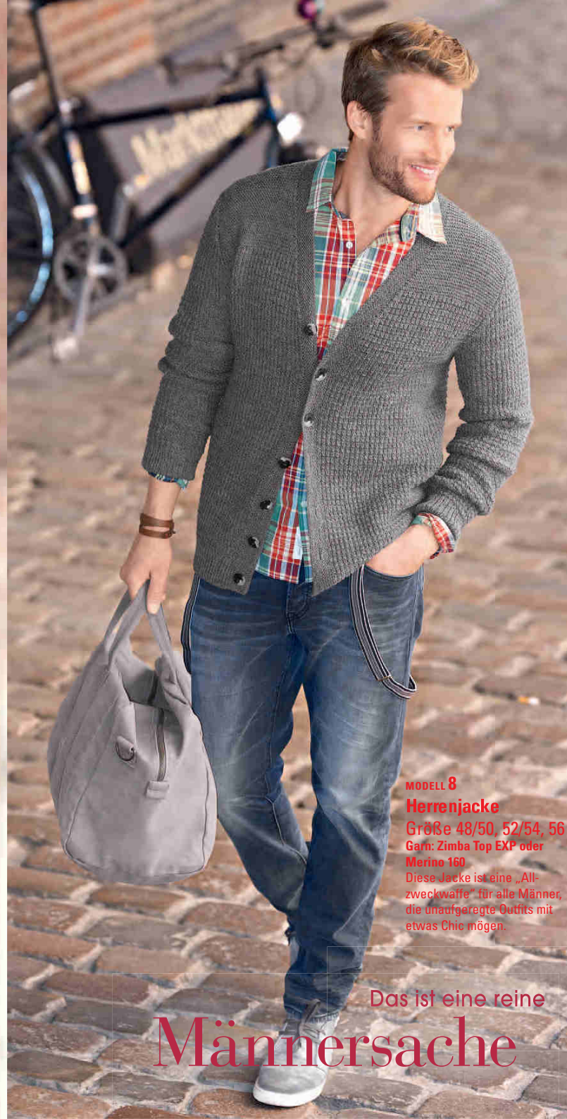
MODELL 8 Herrenjacke Größe 48/50, 52/54, 56 Garn: Zimba Top EXP oder Merino 160 Diese Jacke ist eine „All- zweckwaffe“ für alle Männer, die unaufgeregte Outfits mit etwas Chic mögen.