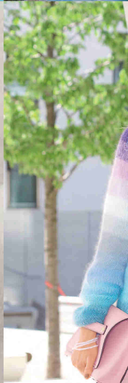
MODELL 12 Damenpulli Größe 36/38, 40/42, 44/46, 48/50 Garn: Kid Silk Die Farbpalette dieses Garnes macht den zauberhaft abgestimmten Streifenverlauf möglich.