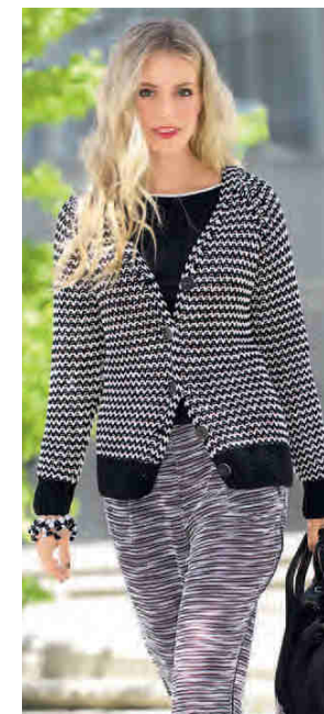
COOL MIT KONTRAST