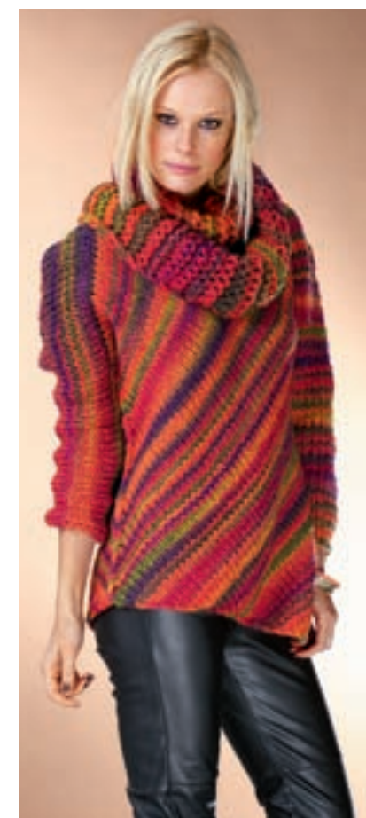
RAFFINIERT IN ROT