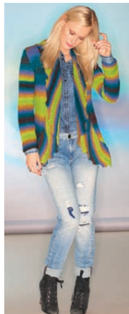
JACKEN ALS ALLROUNDER