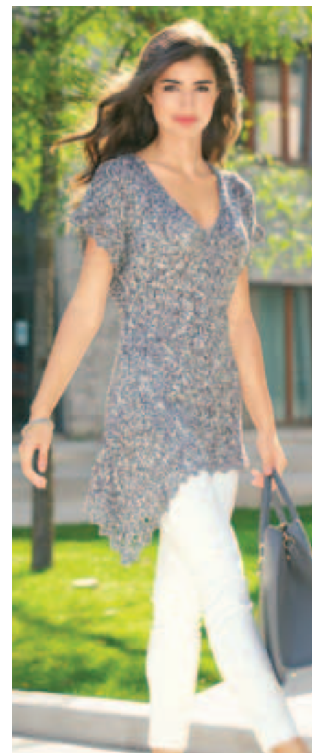
CITY-CHIC MIT STRICK