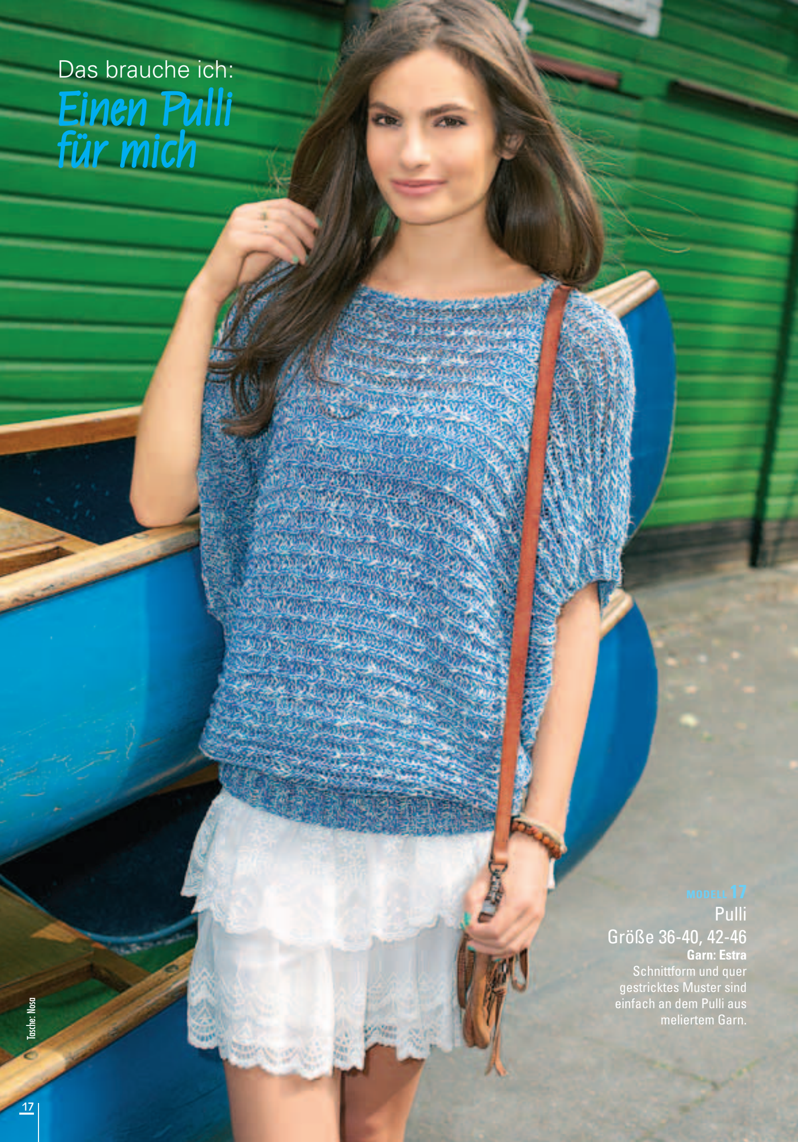
MODELL 17 Pulli Größe 36-40, 42-46 Garn: Estra Schnittform und quer gestricktes Muster sind einfach an dem Pulli aus meliertem Garn.