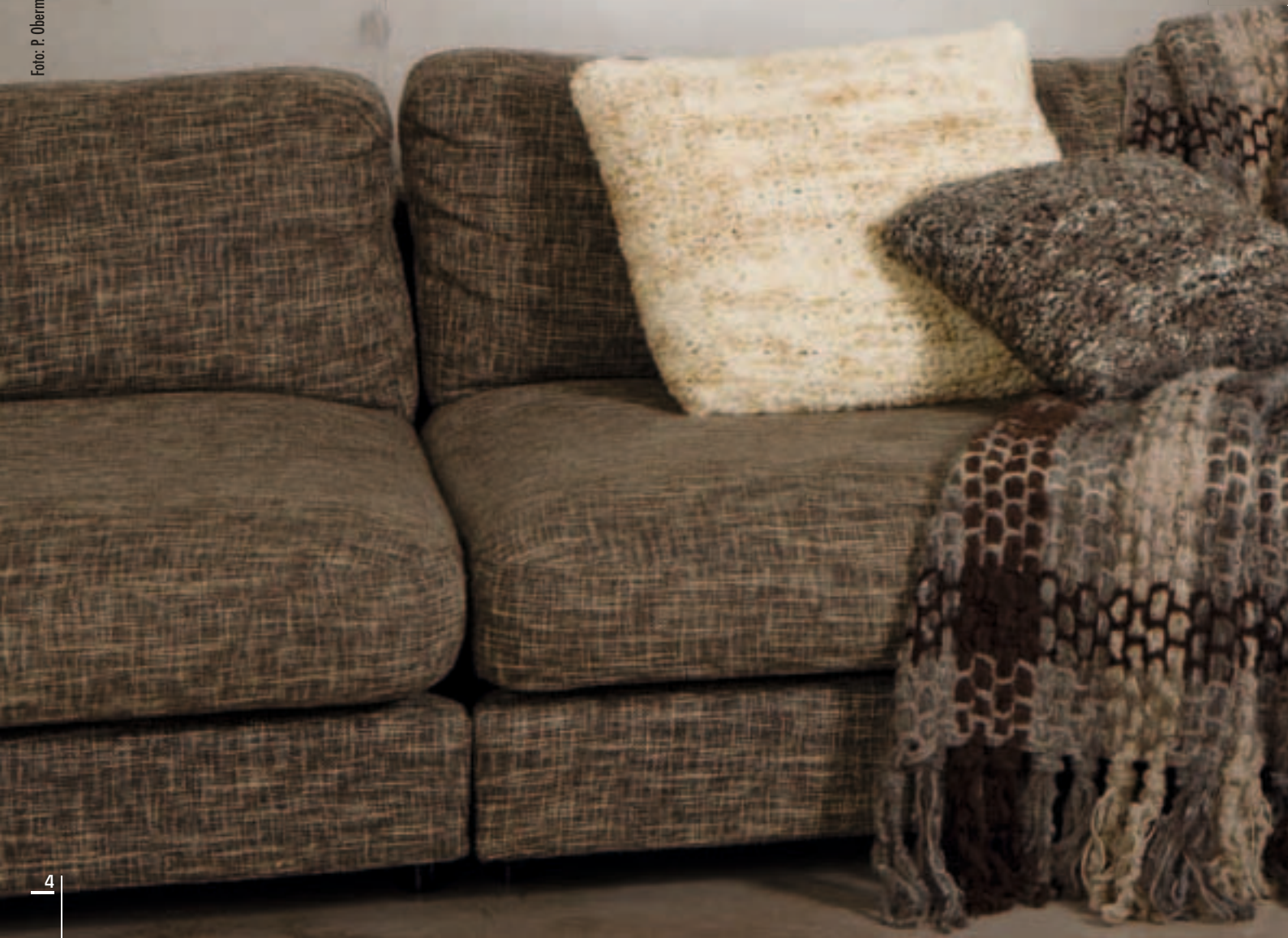
Styling: K. Schlag/A. Werner-Tekeste, Haare & Make up: I. Becker

Bequeme Strickmode zum Anziehen und schicke Wohnaccessoires machen Cocooning vom Feinsten möglich.