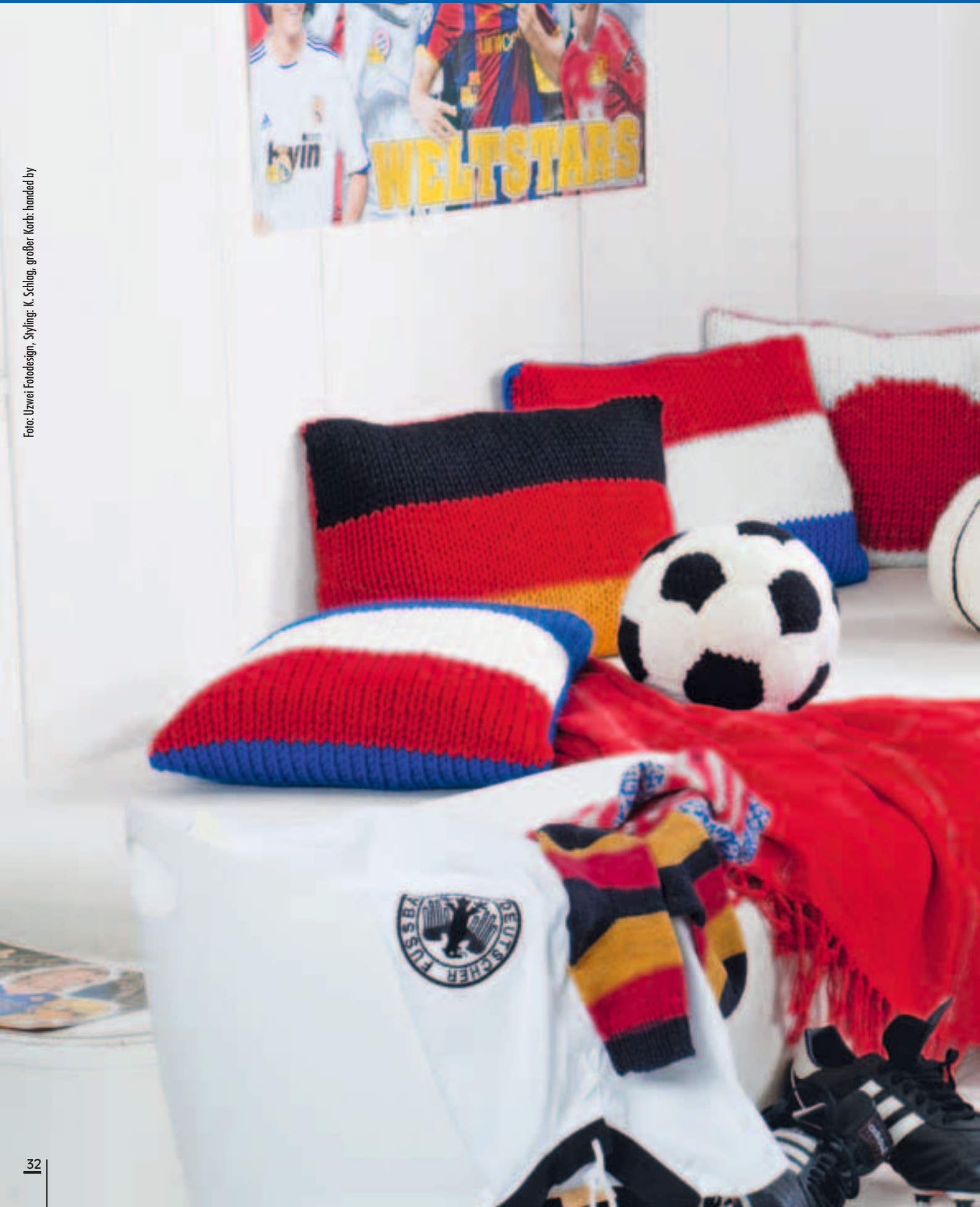
Styling: K. Schlag, großer Korb: handed by