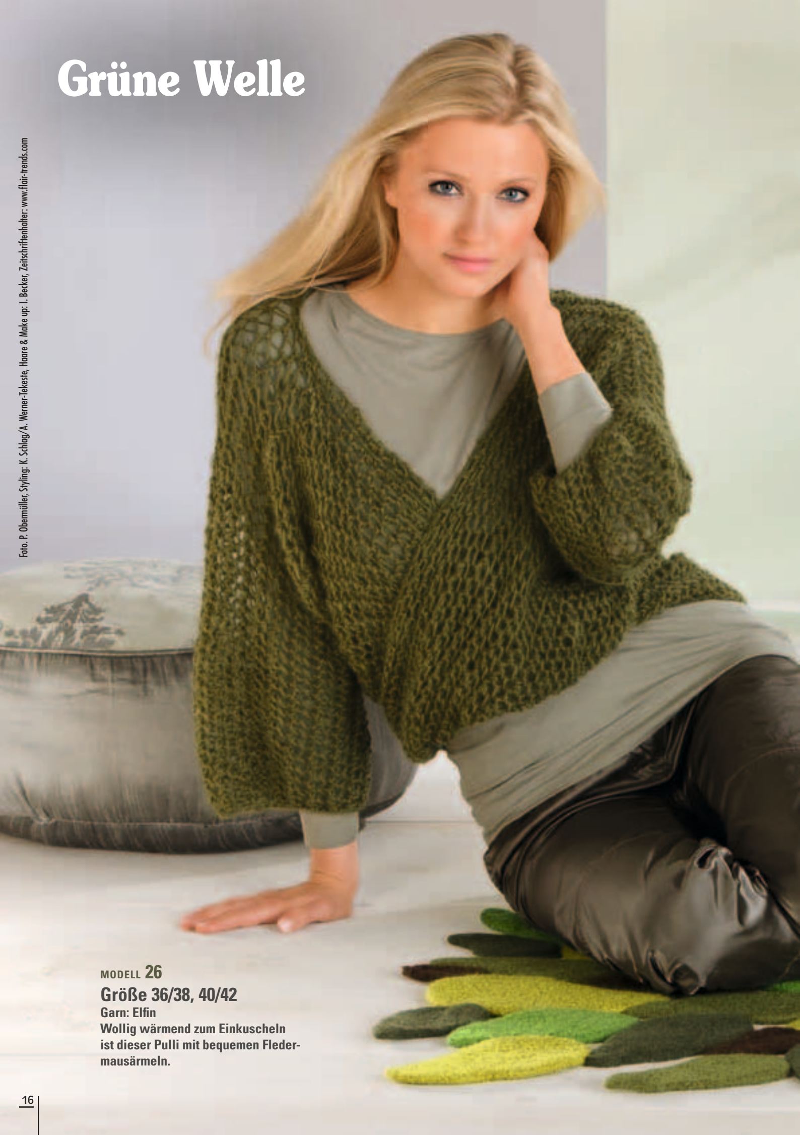
Styling: K. Schlag/A. Werner-Teckste, Haare & Make up: I. Becker, Zeitschriftenhalter: www.flair-trends.com