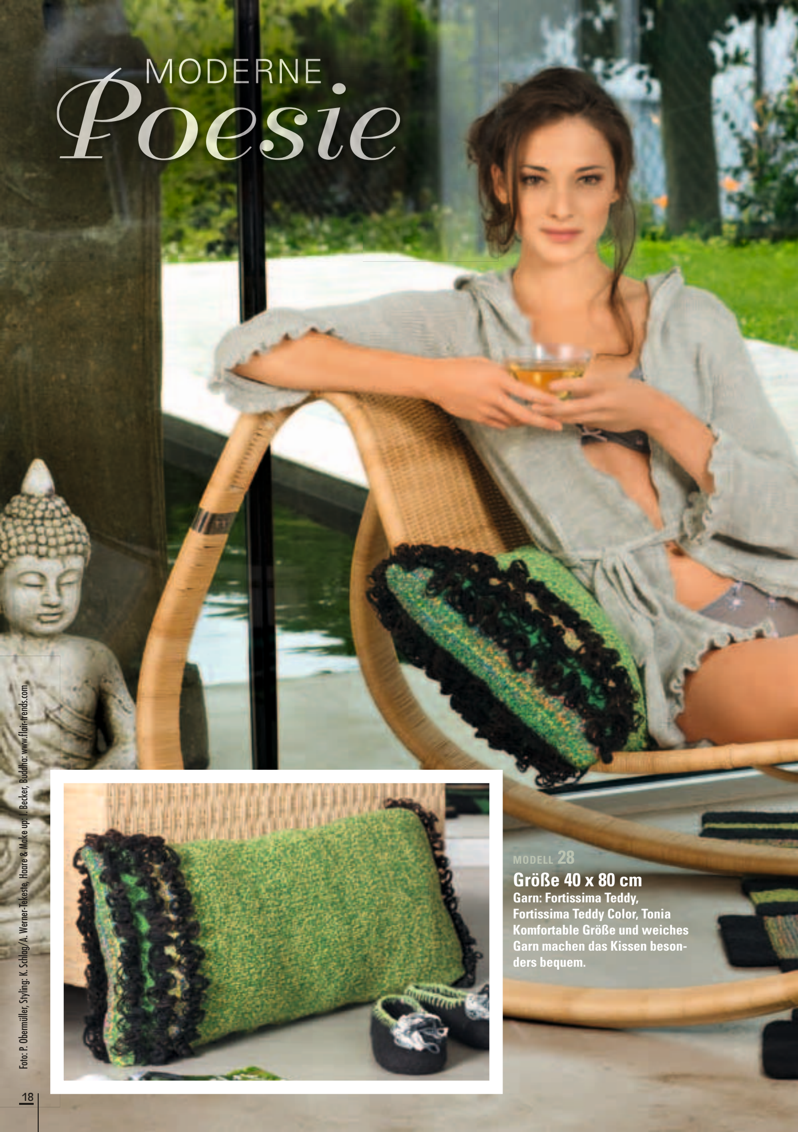
Styling: K. Schlag/A. Werner-Tekste, Haare & Make up: J. Becker, Buddha: www.flair-trends.com