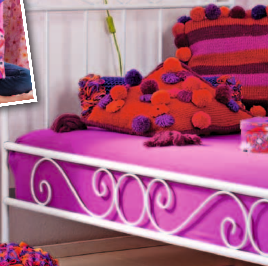
Styling: K. Schlag, großer Korb: handed by