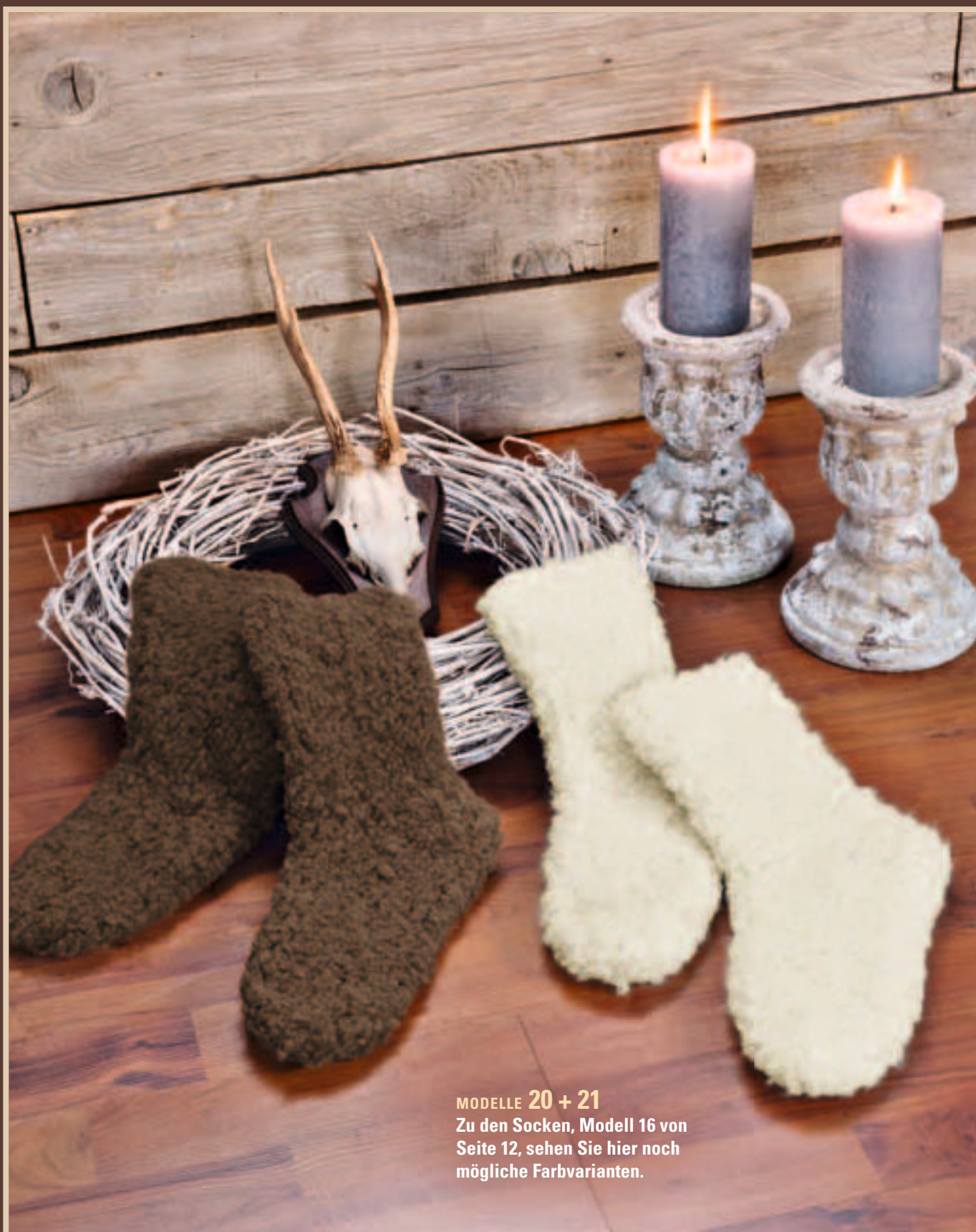
MODELLE 20 + 21 Zu den Socken, Modell 16 von Seite 12, sehen Sie hier noch mögliche Farbvarianten.