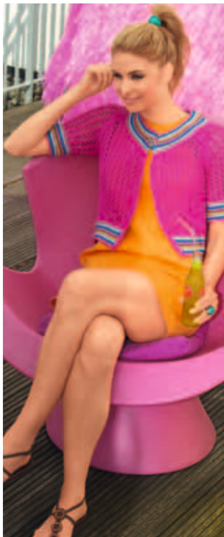
MIT STRICK SIGNALE SETZEN