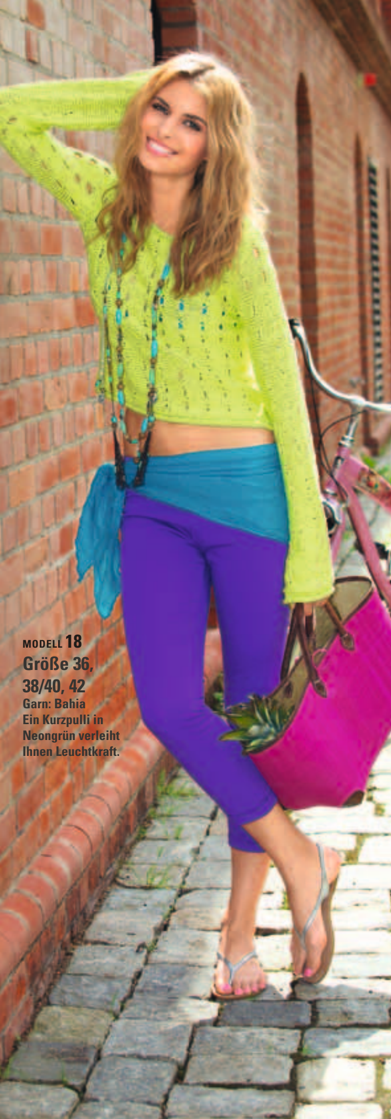
MODELL 18 Größe 36, 38/40, 42 Garn: Bahia Ein Kurzpulli in Neongrün verleiht Ihnen Leuchtkraft.