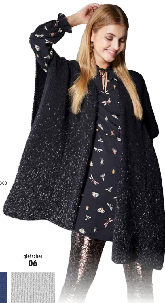
Bild aus Maschen-Style SC 003 Erschienen bei OZ-Verlag