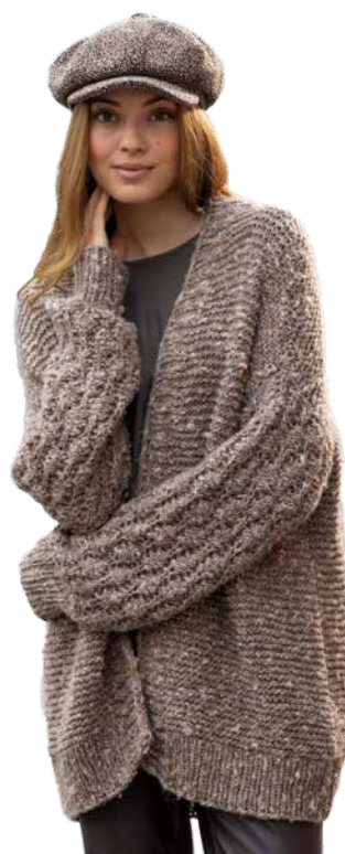
Bild aus Maschen-Style SC 005 Erschienen bei OZ-Verlag