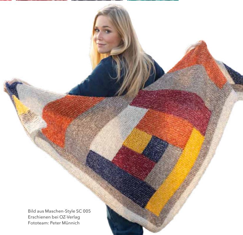
Bild aus Maschen-Style SC 005 Erschienen bei OZ-Verlag