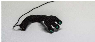
Fingernägel mit smaragd aufsticken