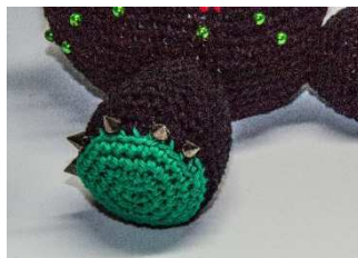
5 Killer-Nieten als Zehen annähen