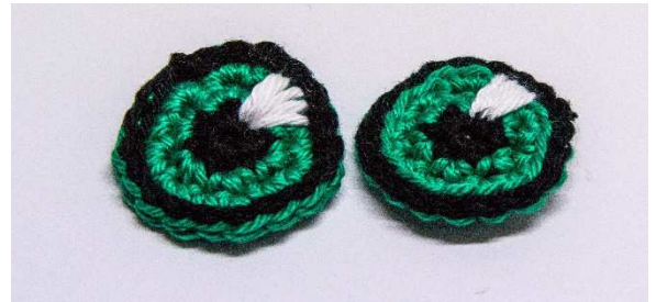
Augen mit aufgestickten Reflexen

Mit weiß die Reflexe auf die Augen sticken.