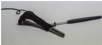
Arm mit Hand, Schlauch mit Draht eingeführt

3 Aludrähte in 15 cm Länge zusammen in einen Schlauch von 11 cm Länge (0,8 cm Durchmesser) einführen. Alles in den Arm bis in die Hand einsetzen. Die herausstehenden Drähte in die Finger einführen. Fingernägel mit smaragd aufsticken.