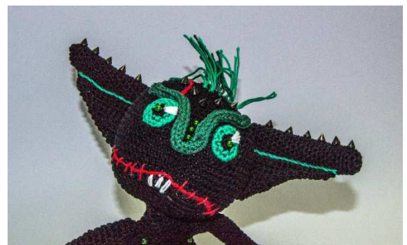
Kopf mit aufgestickten Narben, Zähnen und applizierten Augen

Ca. 10 Fäden à 10 cm Länge aus den beiden Grüntönen auf der Kopfmittle anknüpfen und steif hochkämmen. Je 1 grüne Perle auf die Pupille sticken, 3 weitere auf die Nasenkrümmung.