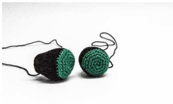
2 ausgestopfte Beine

Die Beine ausstopfen und wie auf dem Foto zu sehen, vorne an die Figur nähen. An der Kante von Sohle zu Bein 5 Killernieten als Zehen annähen.