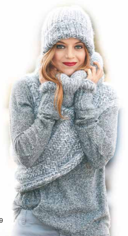
Bild aus Maschen-Style SD 039 Erschienen bei OZ-Verlag, Fototeam Jens-Peter Baser