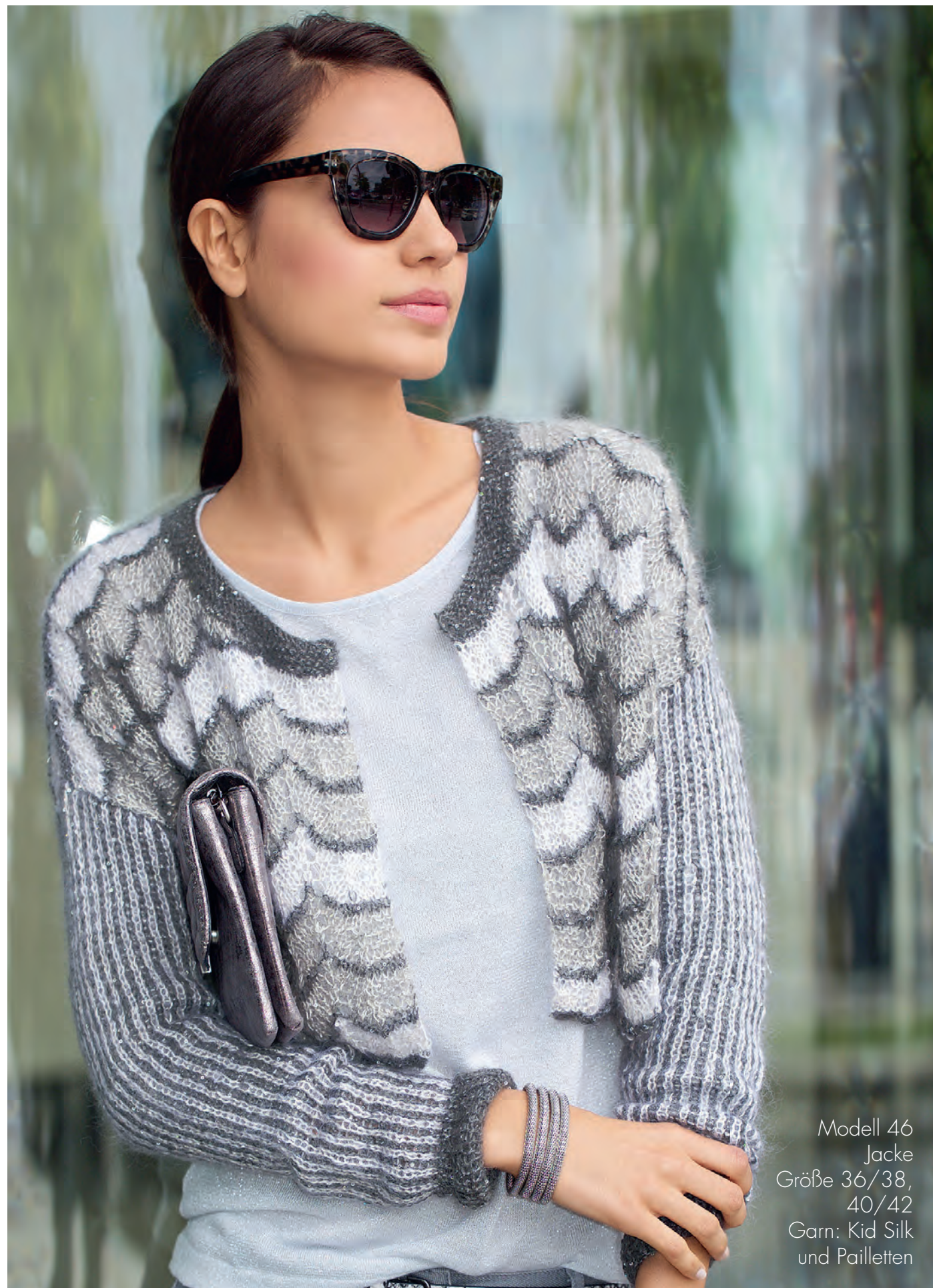
Modell 46 Jacke Größe 36/38, 40/42 Garn: Kid Silk und Pailletten