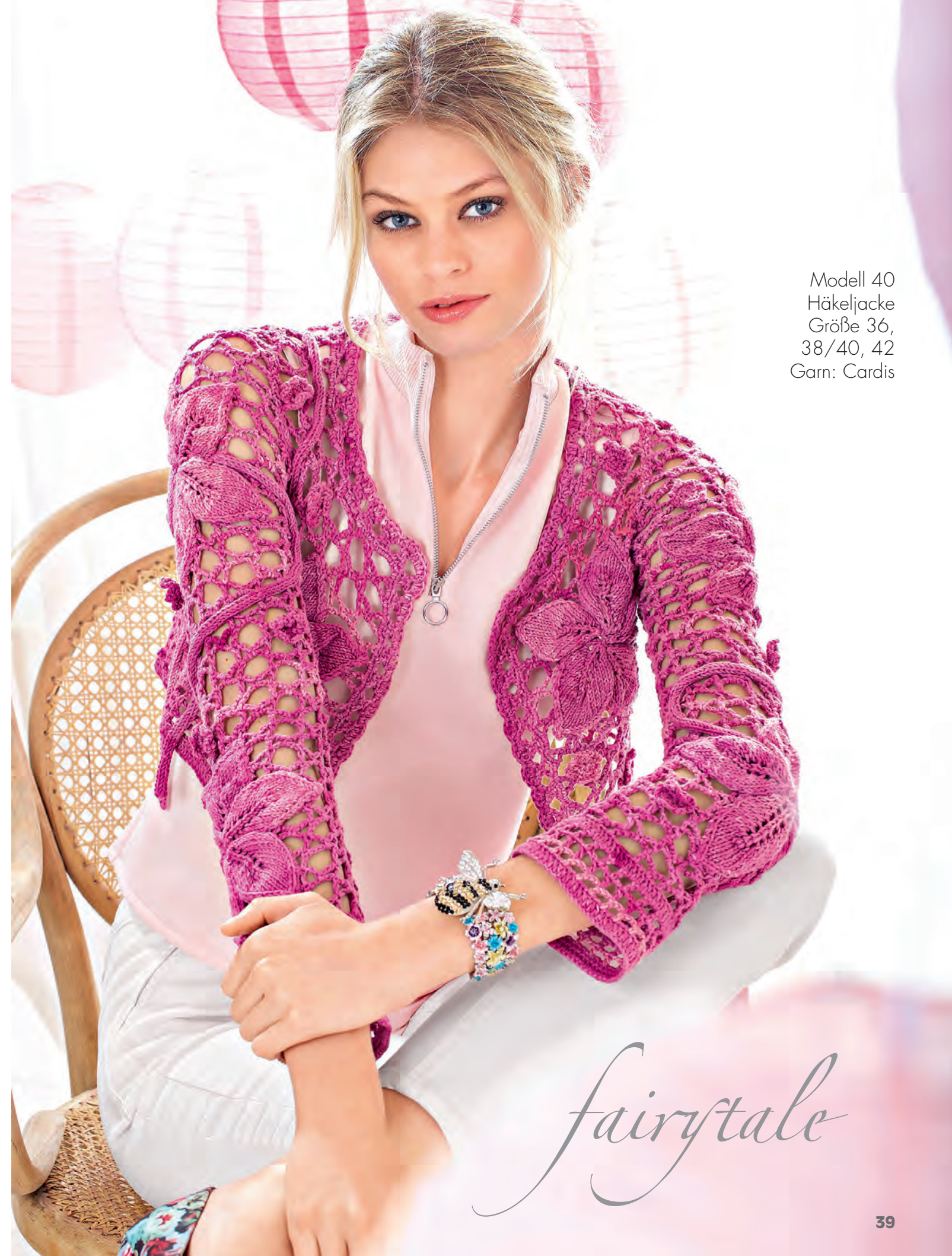
Modell 40 Häkeljacke Größe 36, 38/40, 42 Garn: Cardis