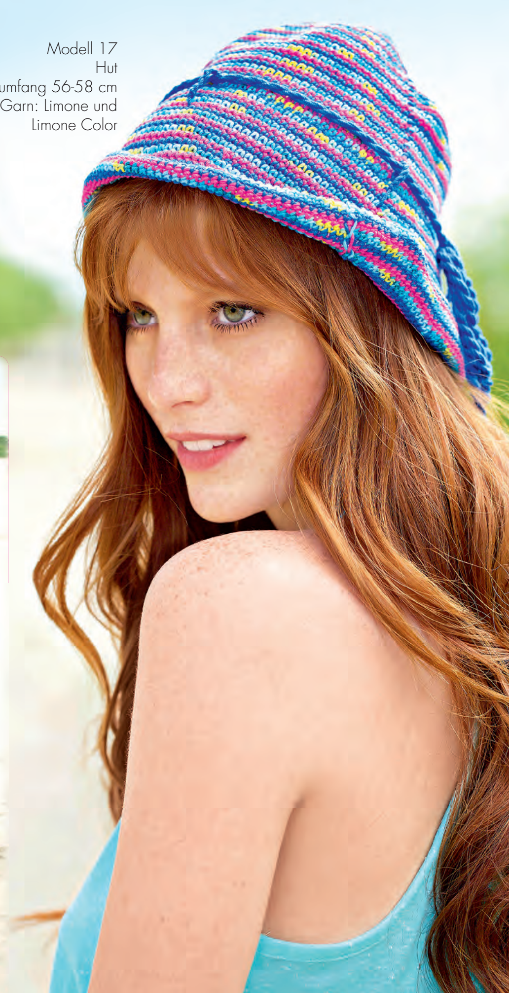
Modell 17 Hut Kopfumfang 56-58 cm Garn: Limone und Limone Color