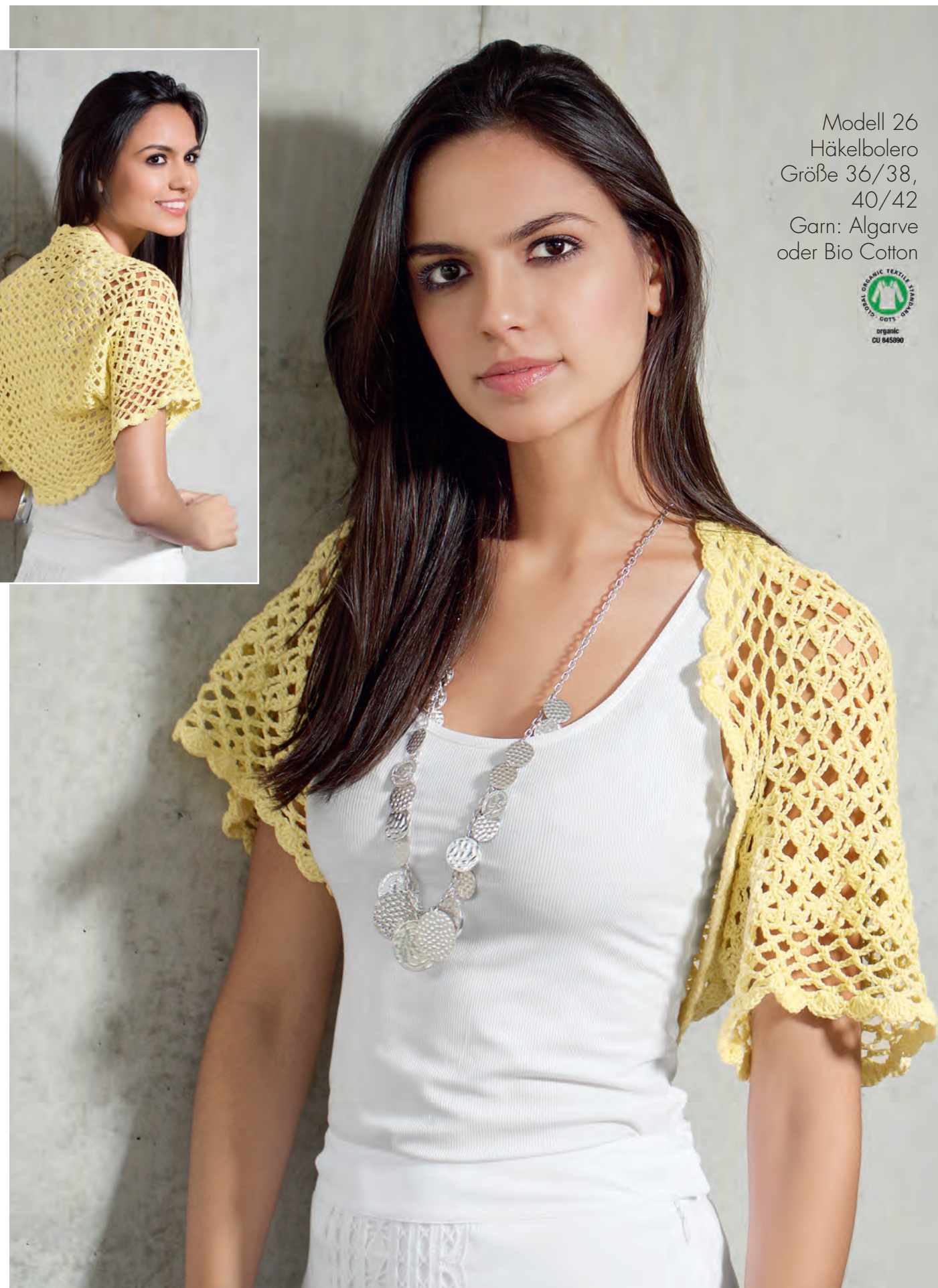
Modell 26 Häkelbolero Größe 36/38, 40/42 Garn: Algarve oder Bio Cotton