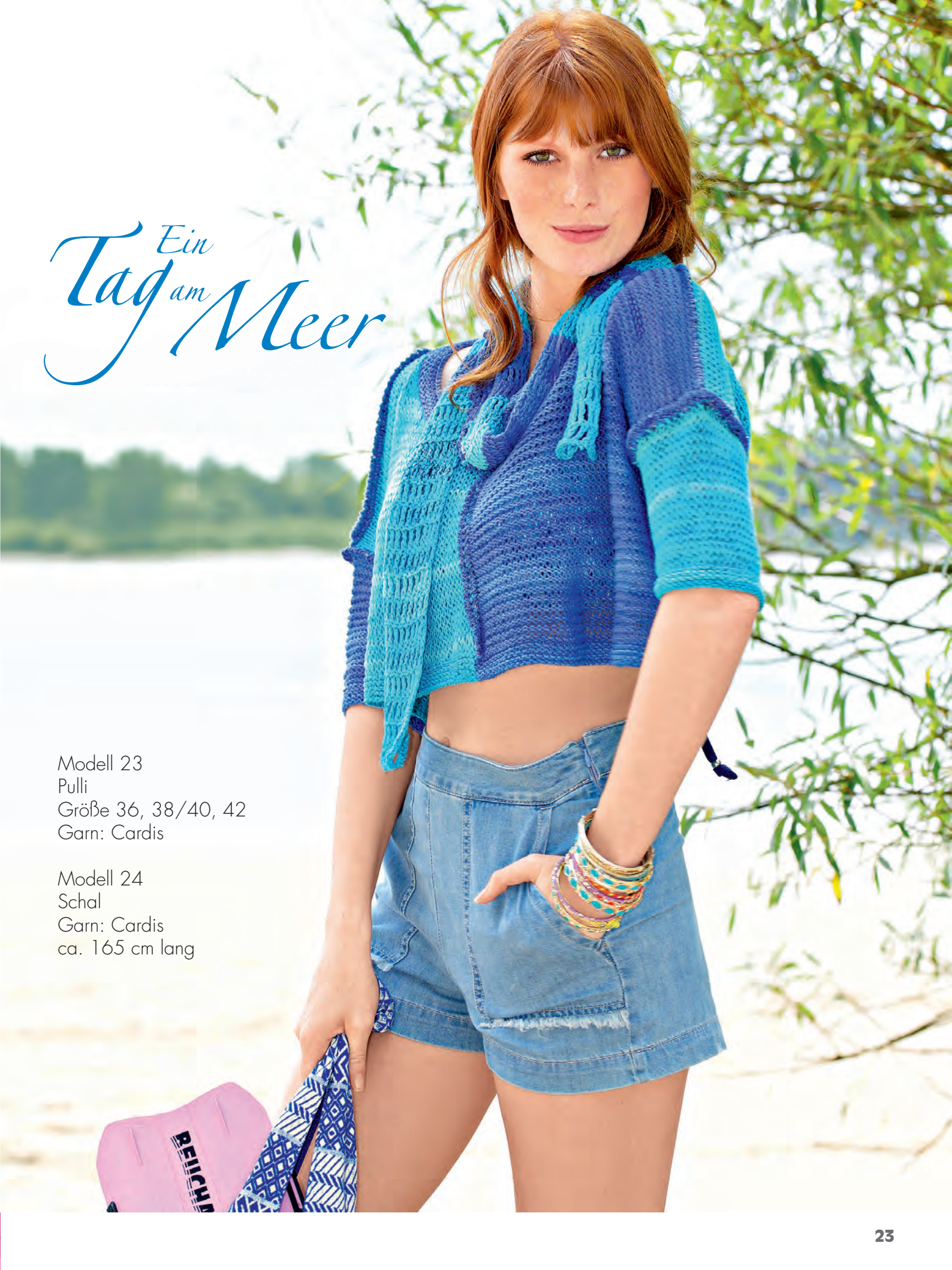
Modell 24 Schal Garn: Cardis ca. 165 cm lang