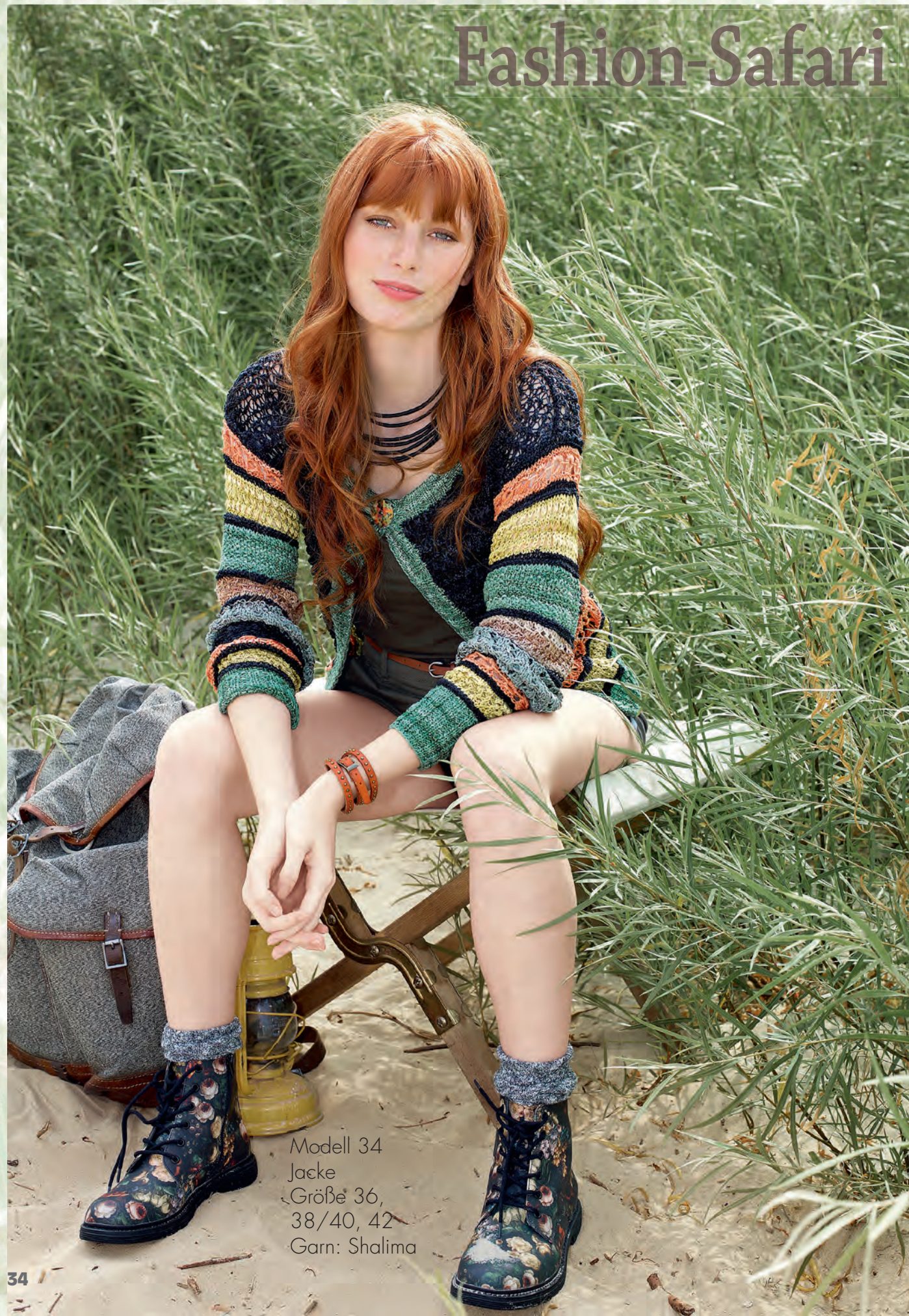
Modell 34 Jacke Größe 36, 38/40, 42 Garn: Shalima