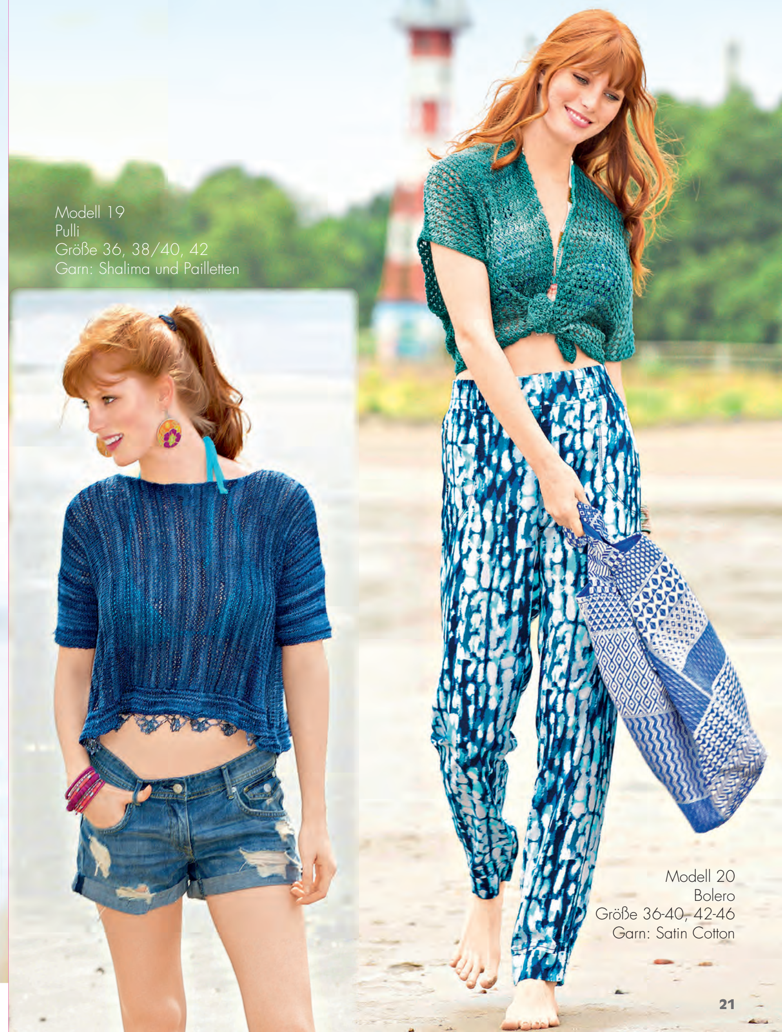
Modell 19 Pulli Größe 36, 38/40, 42 Garn: Shalima und Pailletten