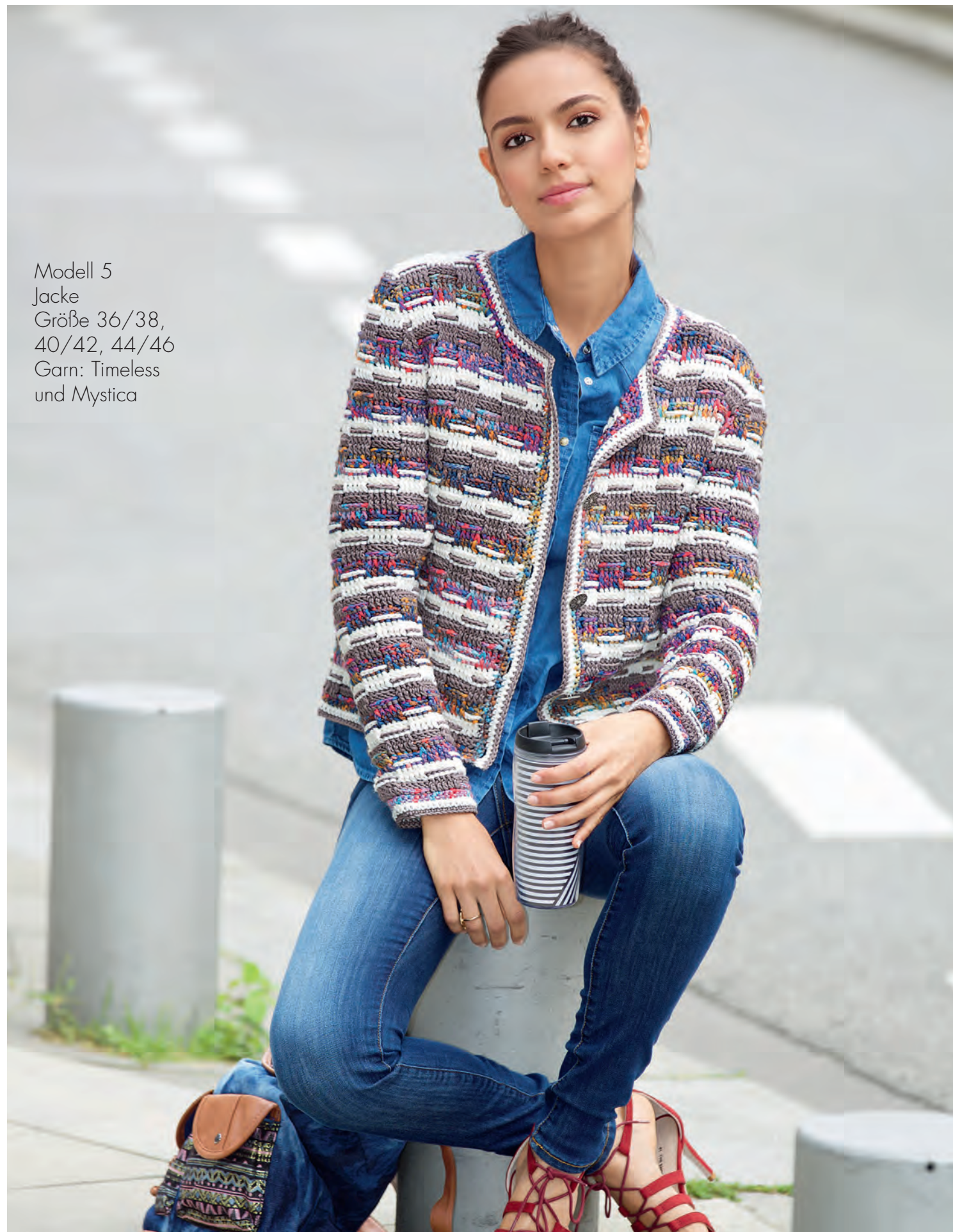
Modell 5 Jacke Größe 36/38, 40/42, 44/46 Garn: Timeless und Mystica