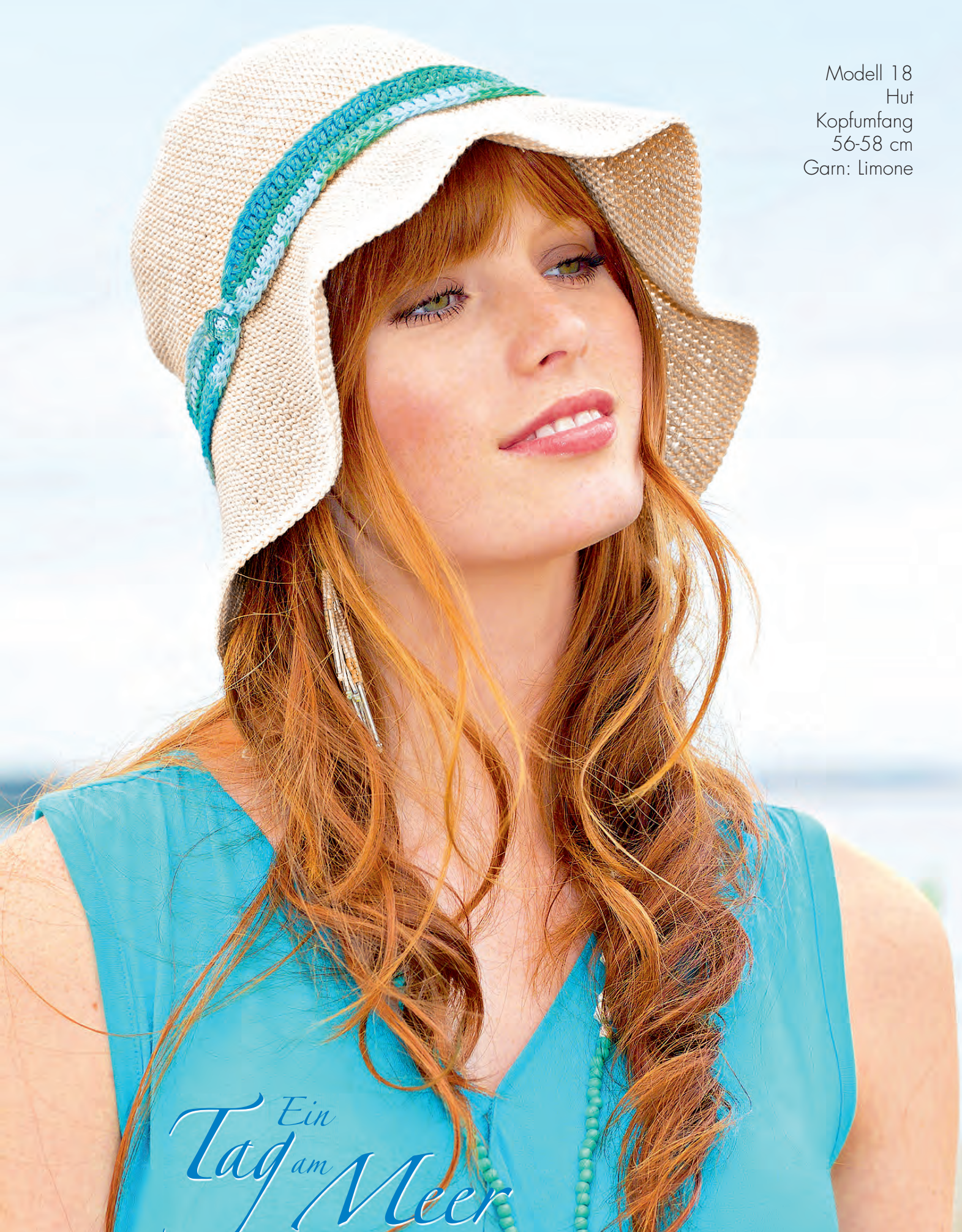
Modell 18 Hut Kopfumfang 56-58 cm Garn: Limone