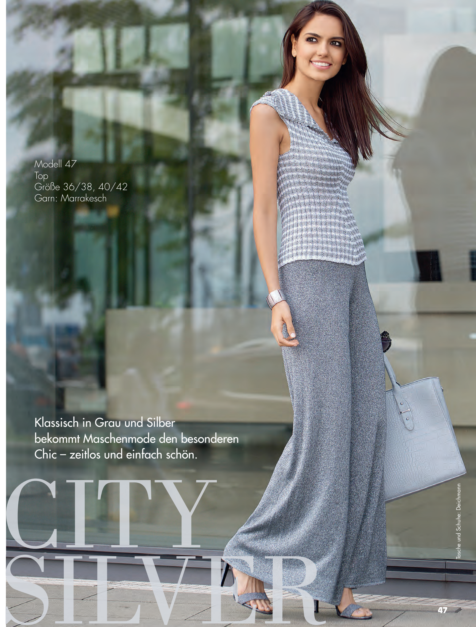
Modell 47 Top Größe 36/38, 40/42 Garn: Marrakesch

Klassisch in Grau und Silber bekommt Maschenmode den besonderen Chic – zeitlos und einfach schön.