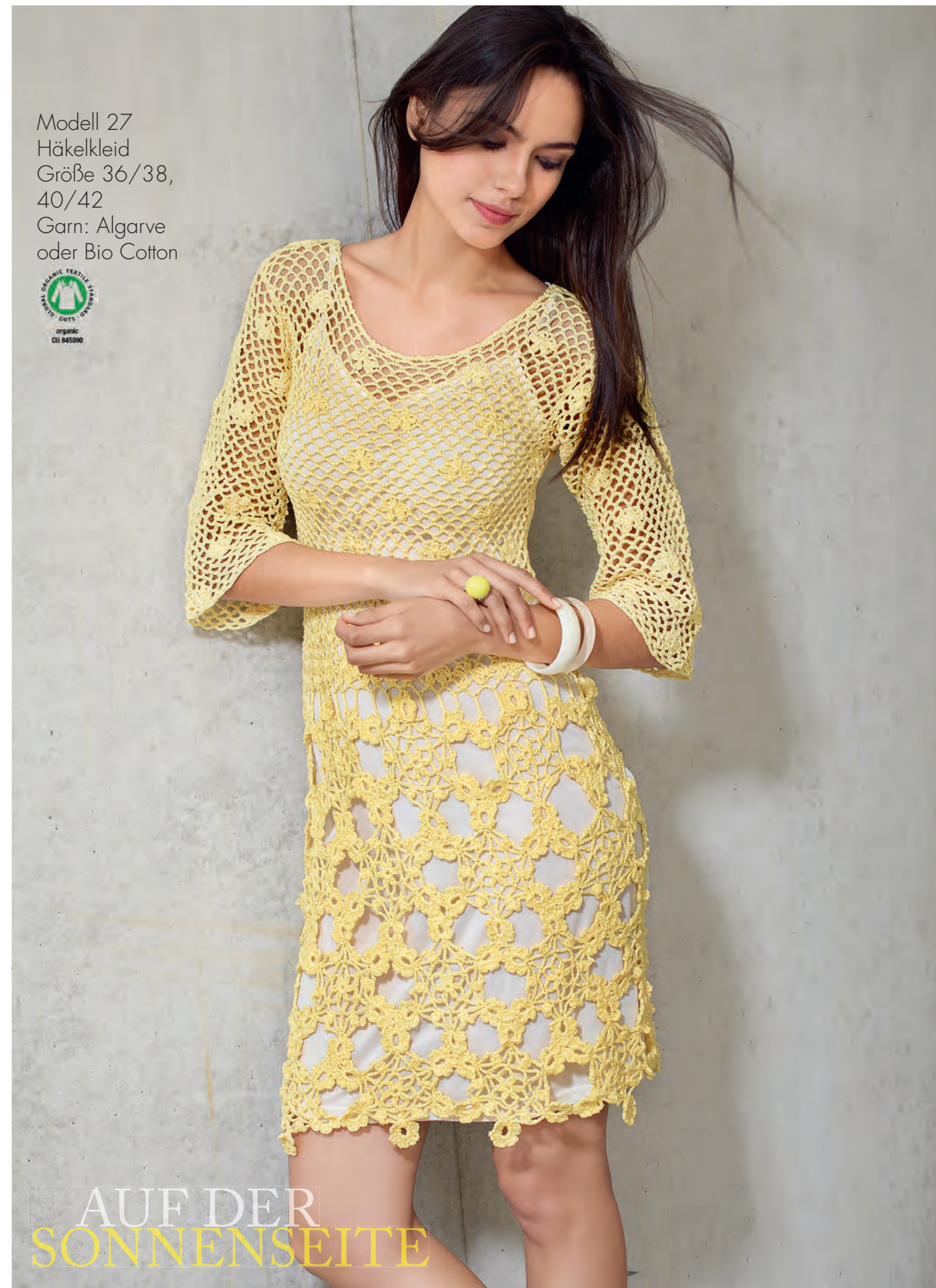
Modell 27 Häkelkleid Größe 36/38, 40/42 Garn: Algarve oder Bio Cotton