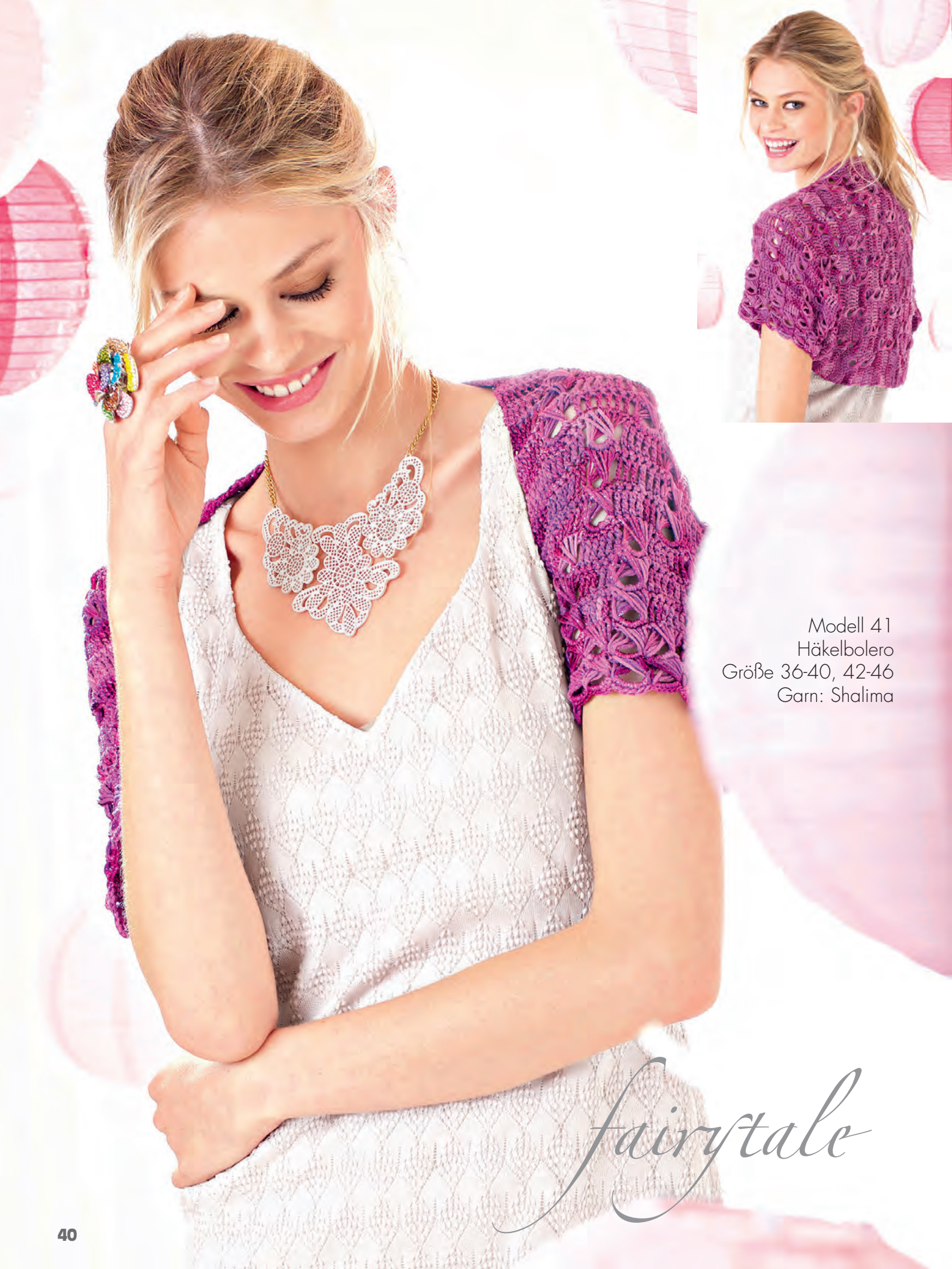
Modell 41 Häkelbolero Größe 36-40, 42-46 Garn: Shalima