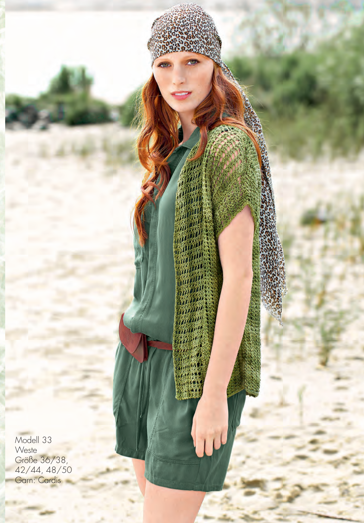
Modell 33 Weste Größe 36/38, 42/44, 48/50 Garn: Cardis