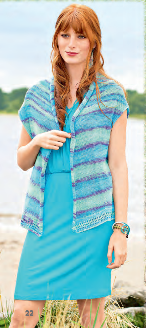
Modell 21b Weste Größe 38/40, 42/44, 46/48 Garn: Bio Cotton Color