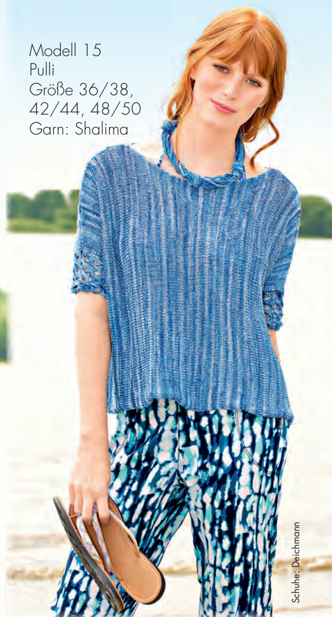
Modell 15 Pulli Größe 36/38, 42/44, 48/50 Garn: Shalima