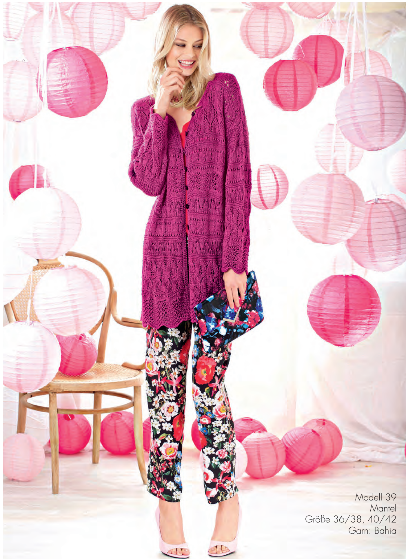
Modell 39 Mantel Größe 36/38, 40/42 Garn: Bahia