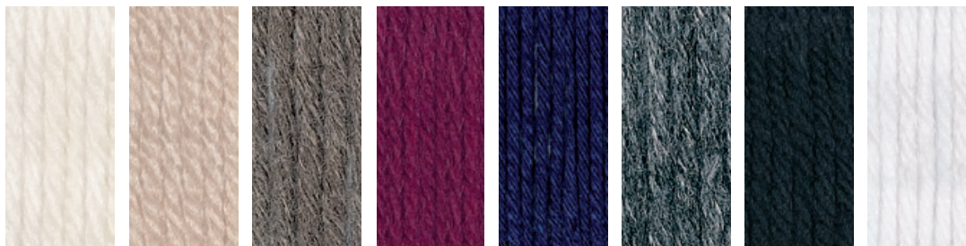
Bild aus Maschen-Style 2/15 erschienen bei OZ Verlag, Fototeam Jochen Frank.