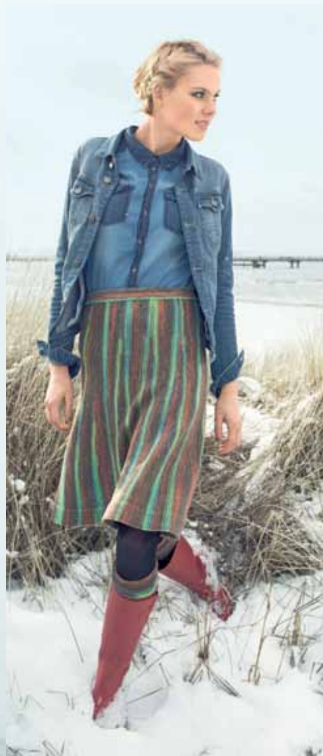
Modell 9 Rock

Größe 36, 38/40, 42/44, 46/48 Garn: Step 6 Irish Rainbow Color