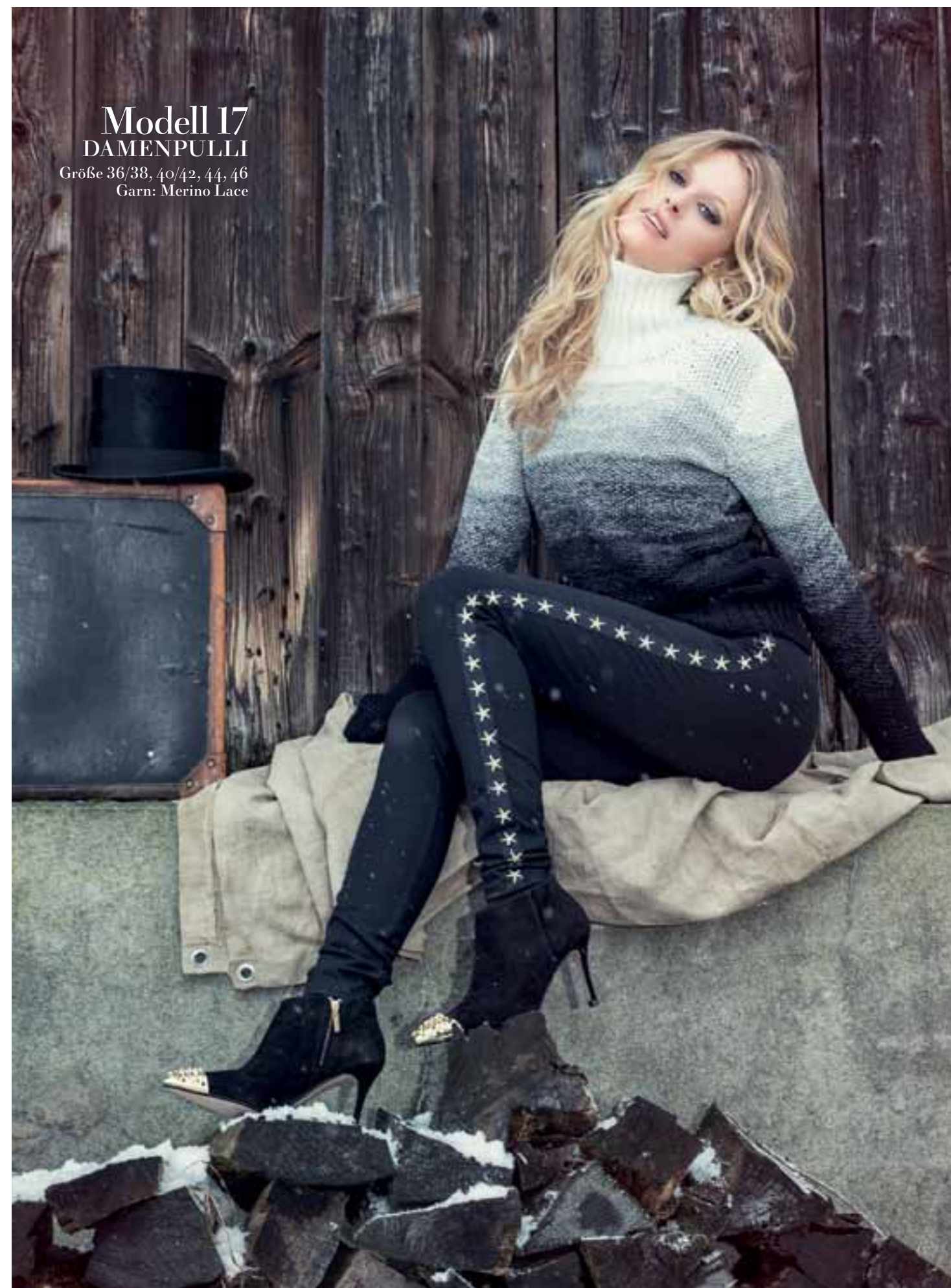
Modell 17 DAMENPULLI

Größe 36/38, 40/42, 44/46, 48 Garn: Irish Tweed und Palila