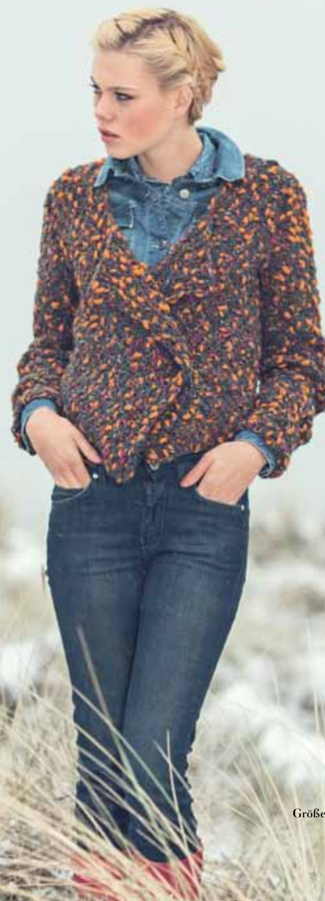
Modell 10 Damenjacke

Trendy Modelle aus weichem STRICK umschmeicheln den Körper und lassen sich perfekt zu coolem DENIM kombinieren.