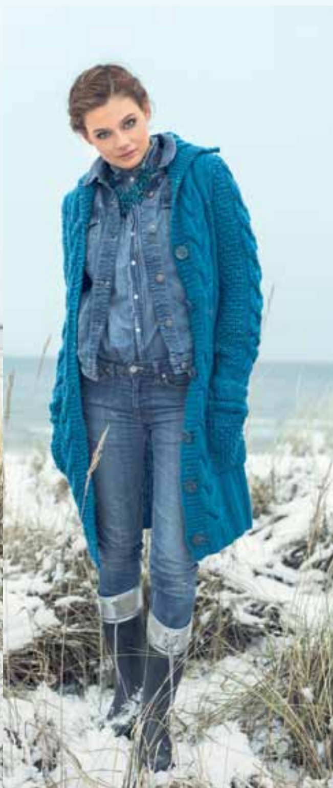
Modell 8 Damenmantel

Größe 36, 38/40, 42/44, 46/48 Garn: Step 6 Irish Rainbow Color