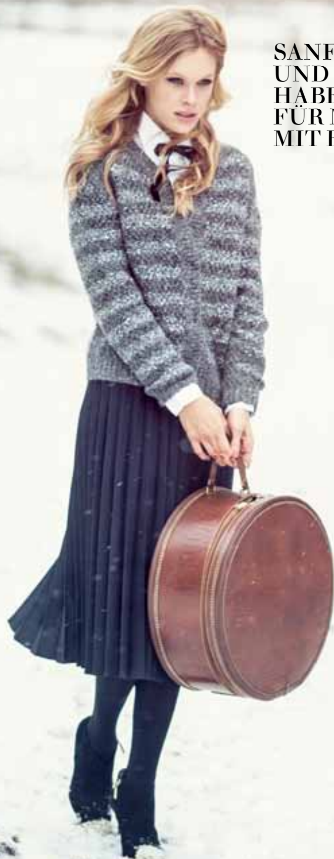
Modell 16 DAMENJACKE

SANFTE FARBÜBERGÄNGE UND DEZENTE MUSTER HABEN DAS POTENZIAL FÜR MASCHENMODE MIT ELEGANTEM TOUCH.