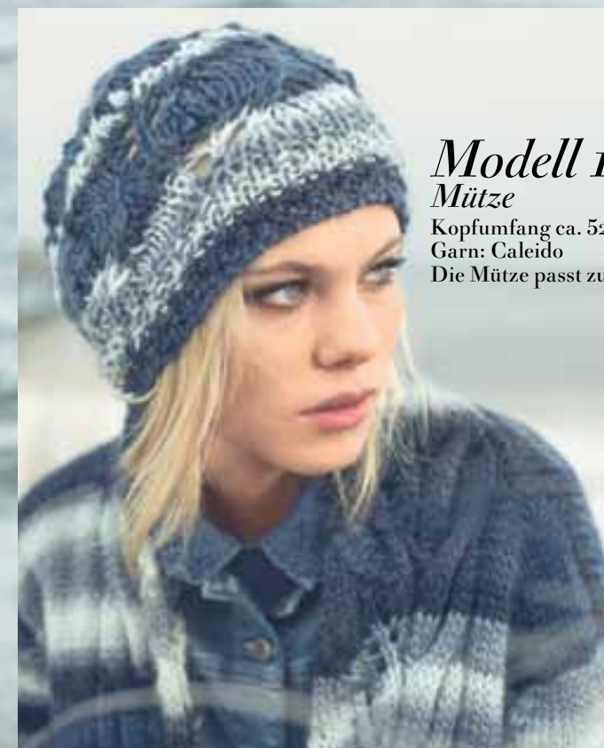
Modell 12 Mütze

Hier ist für WÄRME und Wohlbehagen um Kopf und Hals gesorgt. Mützen liegen im Fashion-Trend und der Riesen-Loop überzeugt.