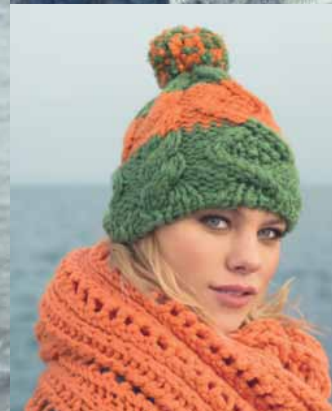
Modell 13 Mütze

Kopfumfang ca. 52 - 56 cm Garn: Caleido Die Mütze passt zur Jacke Modell 7