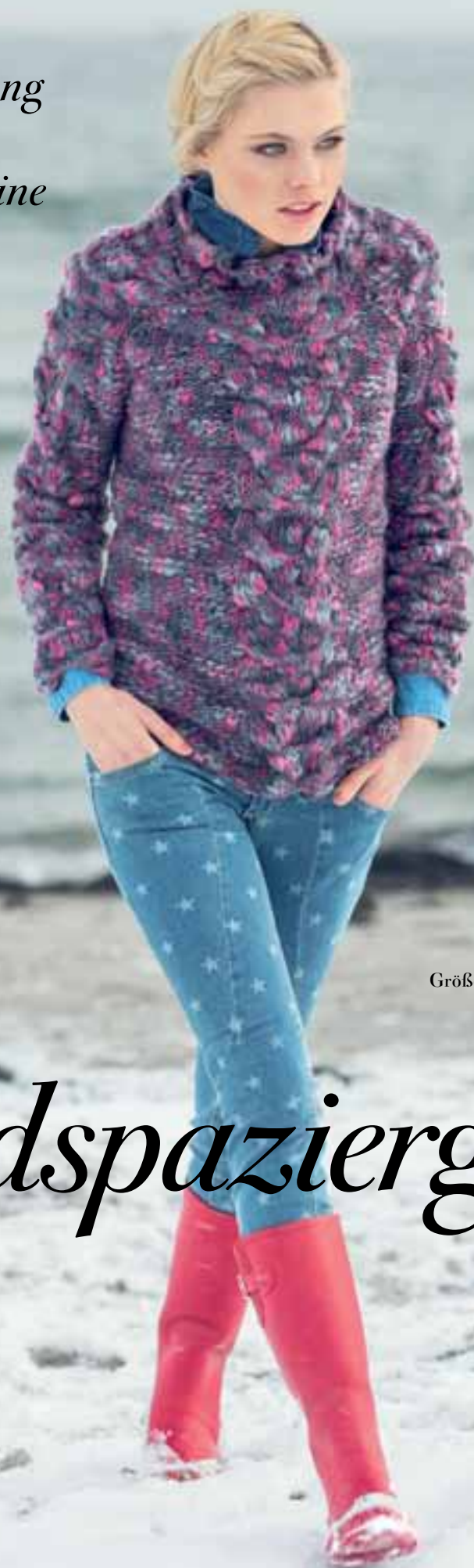
Modell 1 Damenpulli Größe 36/38, 40/42, 44/46, 48 Garn: Mariana Color

Das ist Entspannung pur! Rauschendes Meer, klare Luft, eine frische Brise und SCHICKE PULLOVER zum Einkuscheln.