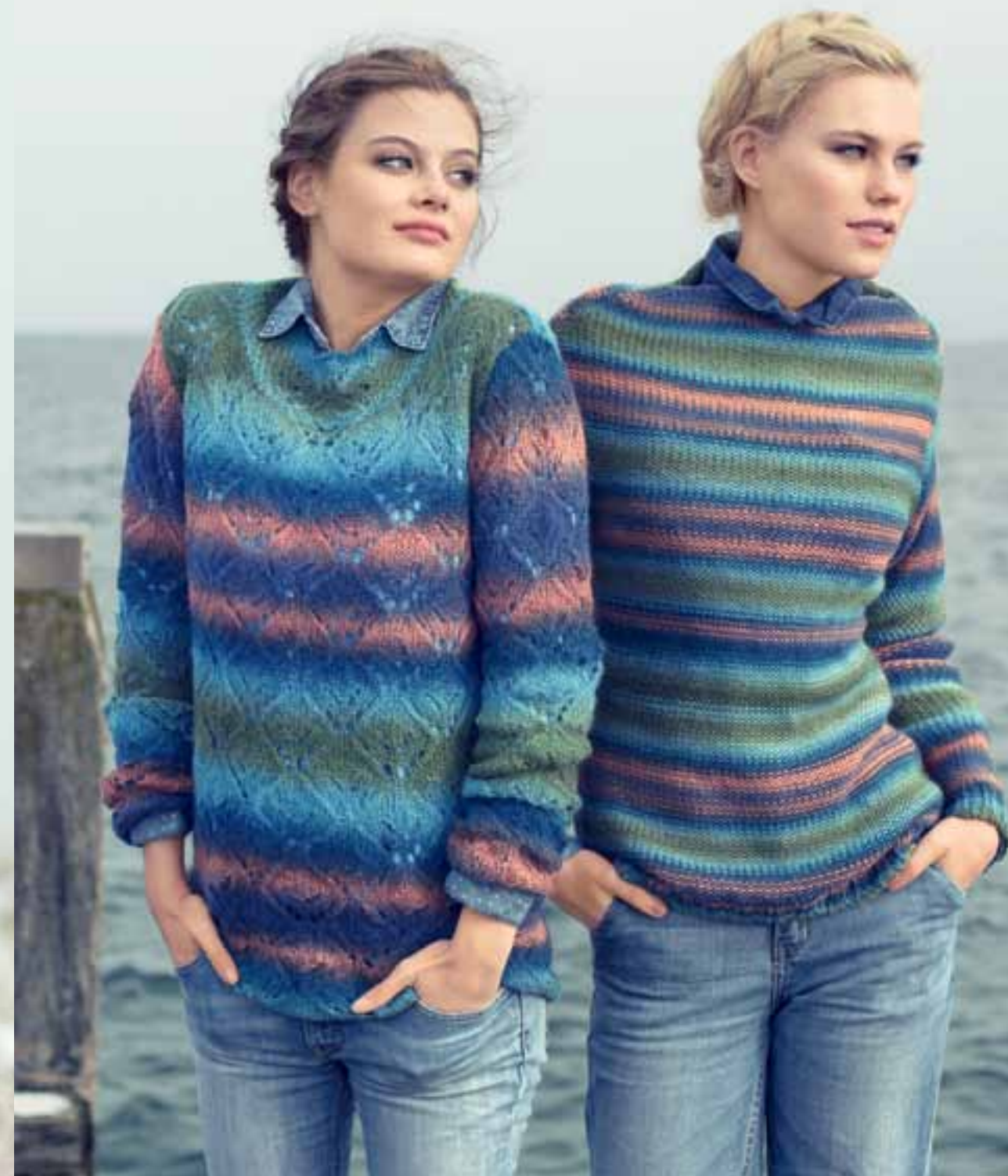
Modell 2 Damenpulli Größe 36/38, 40/42, 44/46, 48 Garn: Calcido Lace