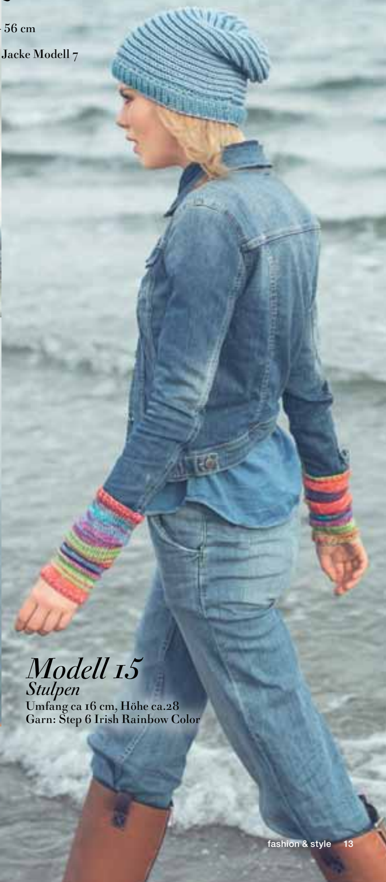
Modell 15 Stulpen

Kopfumfang ca. 52 - 56 cm Garn: Alpaca Silk und Merino 105