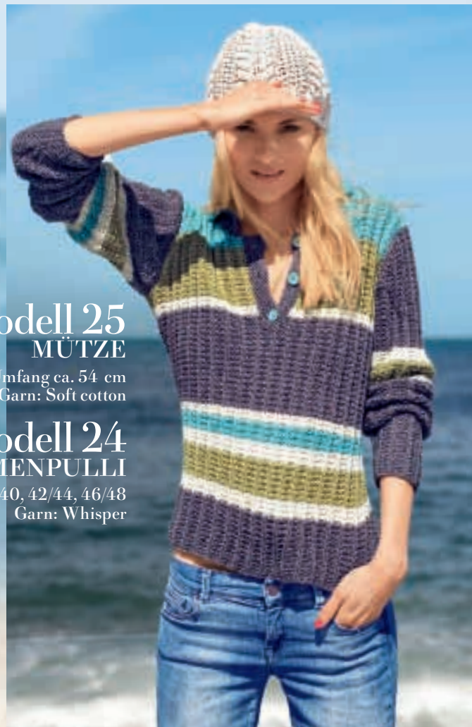
Modell 24 DAMENPULLI Größe 36, 38/40, 42/44, 46/48 Garn: Whisper