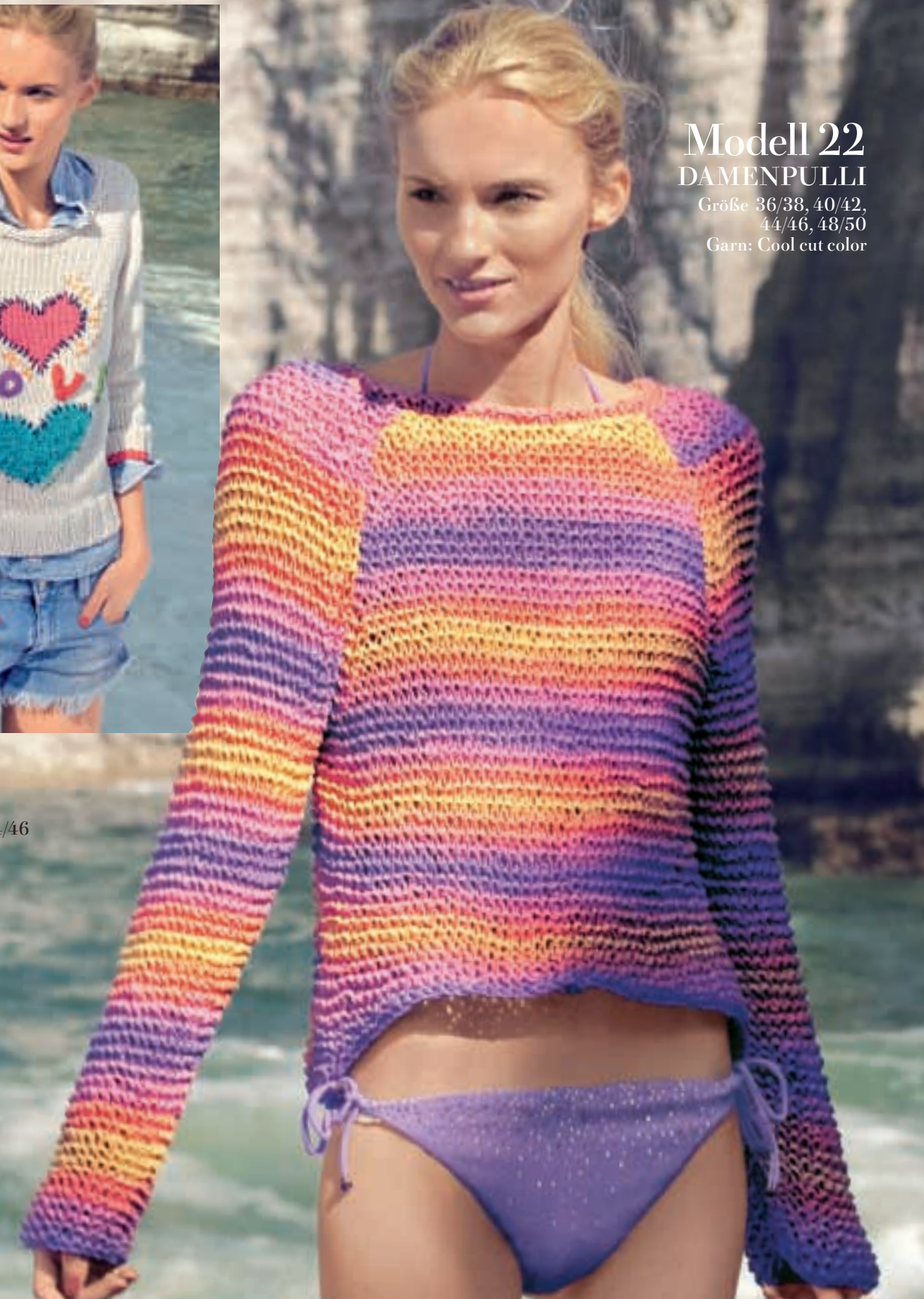
Modell 22 DAMENPULLI

Größe 36, 38/40, 42, 44/46 Garn: Soft cotton, Frizzy, Algarve