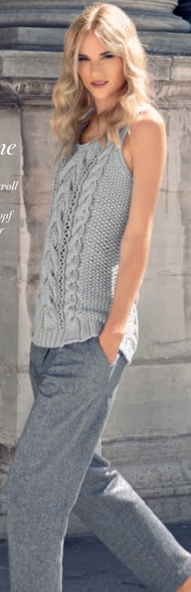
Damenpulli Größe 36, 38/40, 42, 44/46 Garn: Soft cotton Modell 10

Muster-Maschen überzeugen ausdrucksvoll auf der ganzen Fläche oder als markanter Zopf als außergewöhnlicher Blickfang.