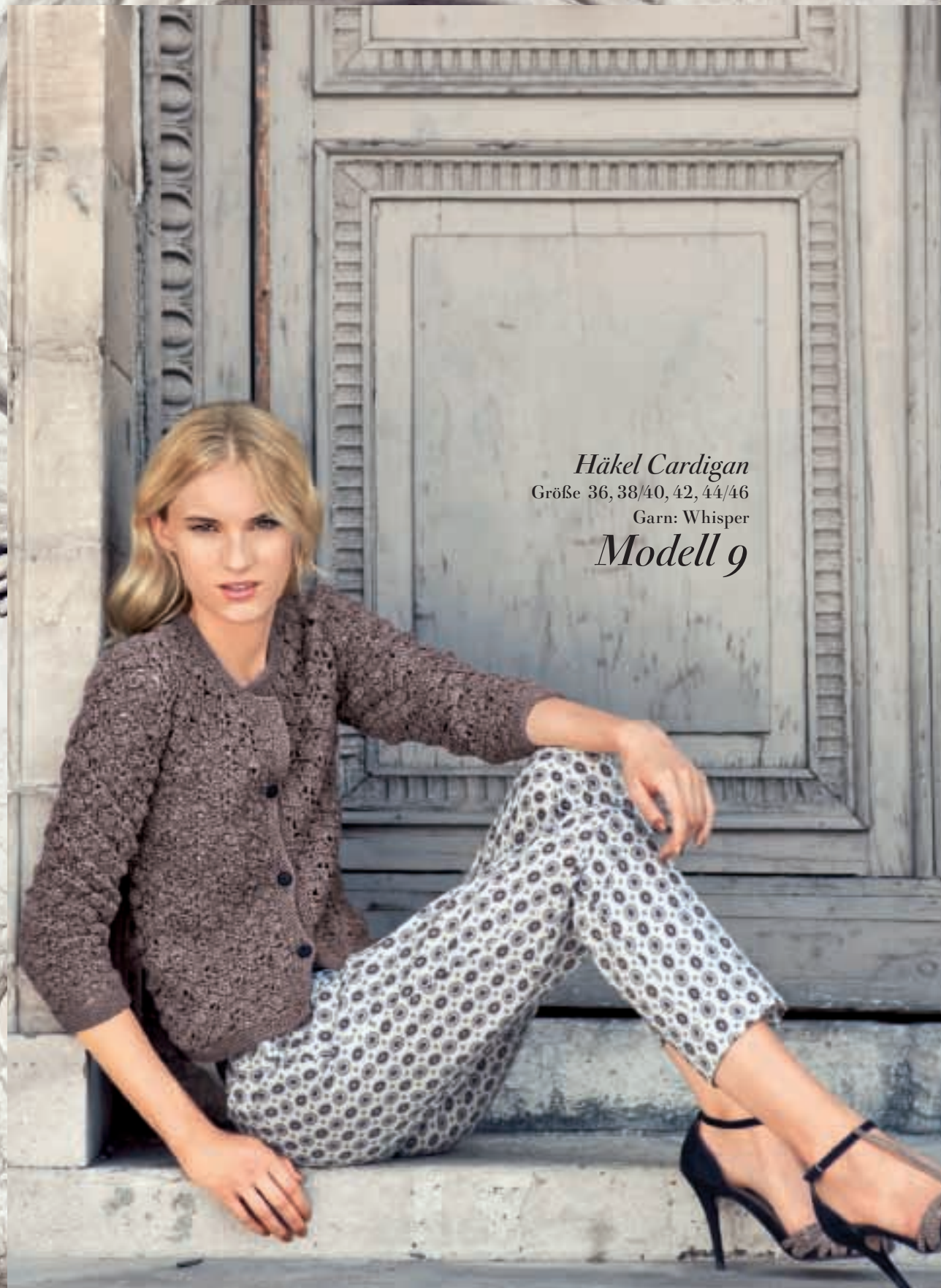
Häkel Cardigan Größe 36, 38/40, 42, 44/46 Garn: Whisper Modell 9