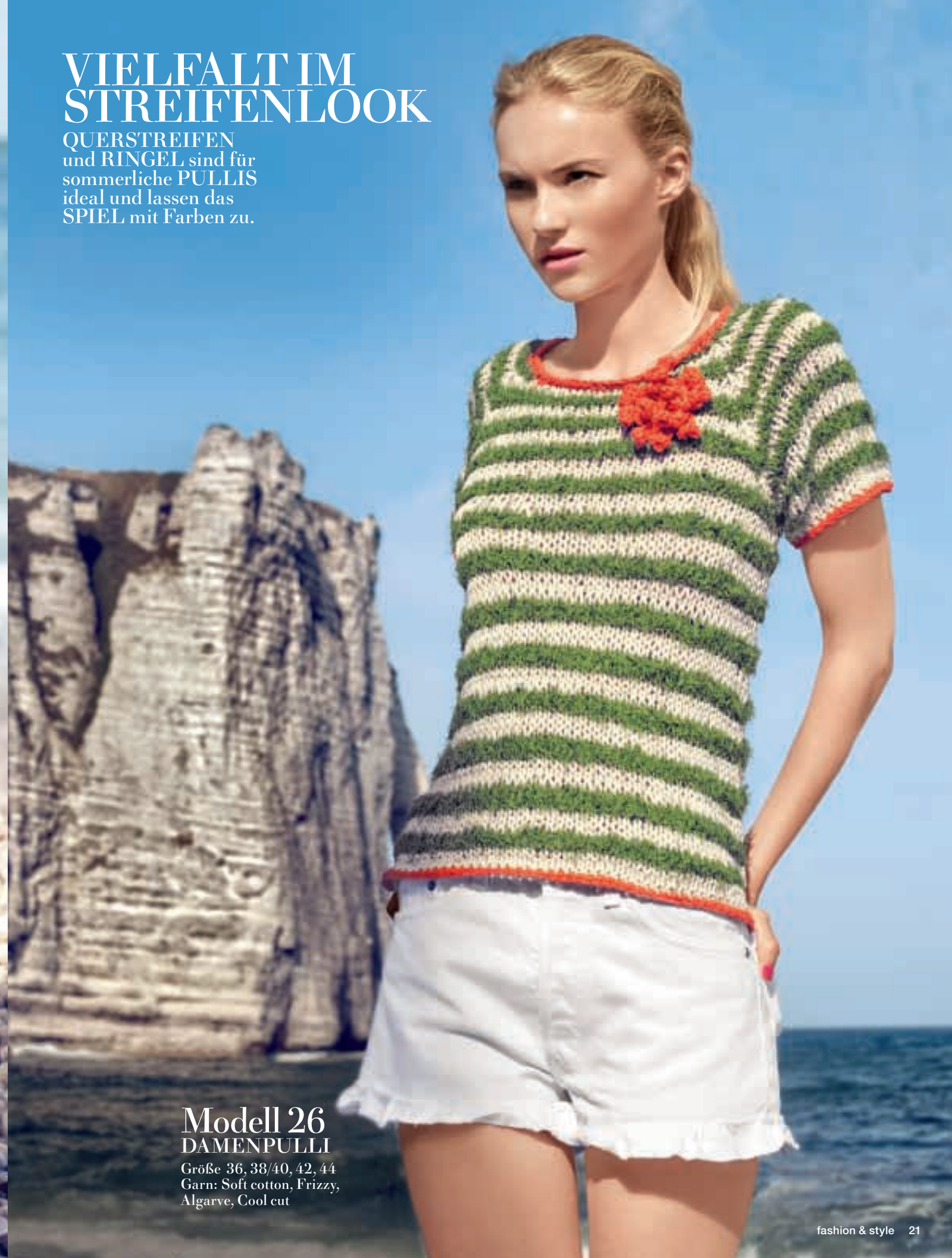
Modell 26 DAMENPULLI Größe 36, 38/40, 42, 44 Garn: Soft cotton, Frizzy, Algarve, Cool cut

QUERSTREIFEN und RINGEL sind für sommerliche PULLIS ideal und lassen das SPIEL mit Farben zu.