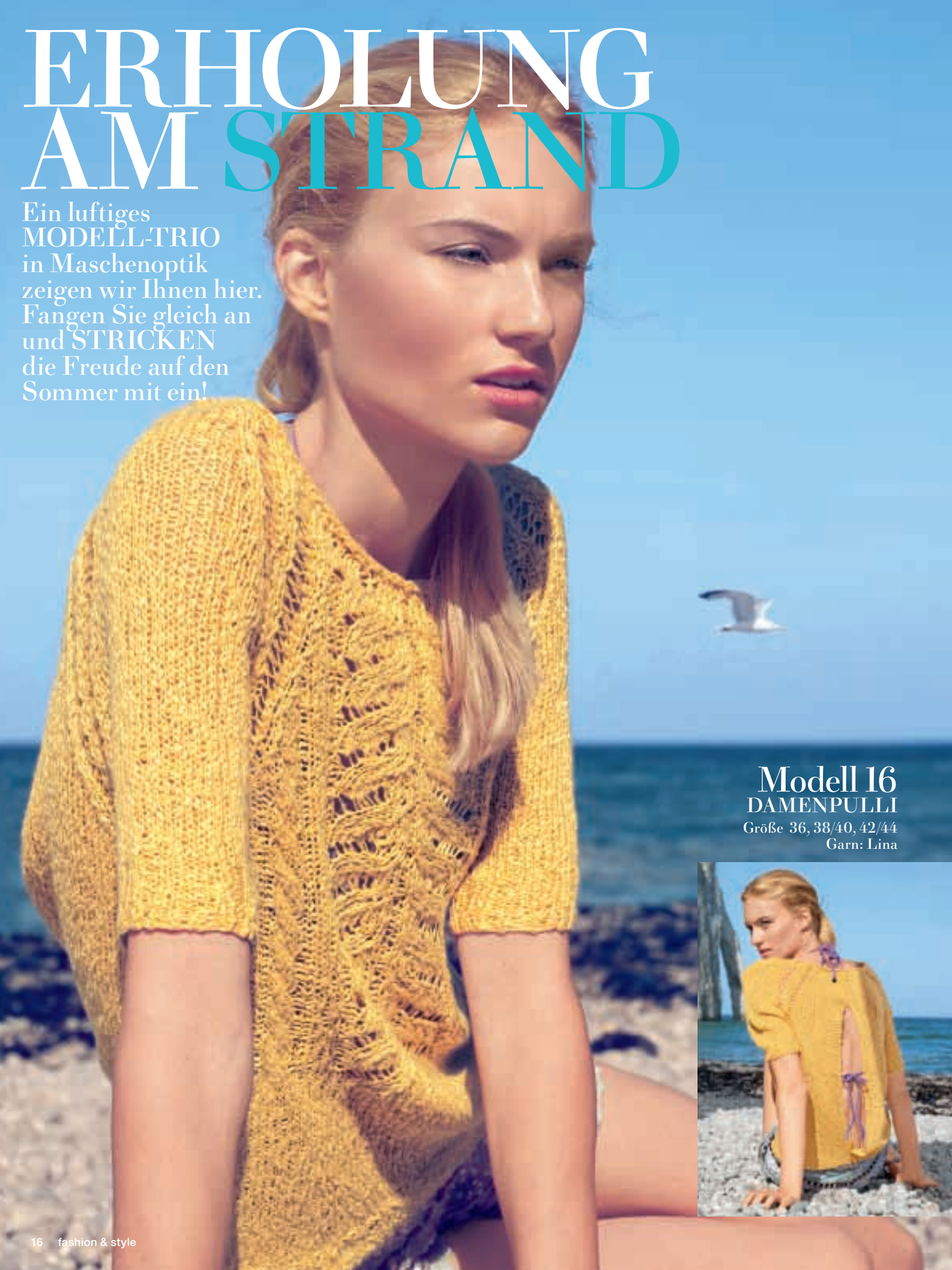
Modell 16 DAMENPULLI Größe 36, 38/40, 42/44 Garn: Lina

Ein luftiges MODELL-TRIO in Maschenoptik zeigen wir Ihnen hier. Fangen Sie gleich an und STRICKEN die Freude auf den Sommer mit ein!