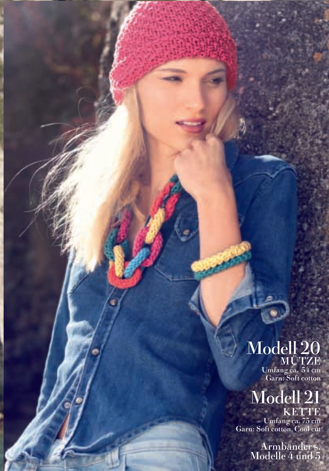
Modell 20 MÜTZE

Hier wird es BUNT! Farbverläufe, Motive und ACCESSOIRES machen LUST auf MASCHEN.