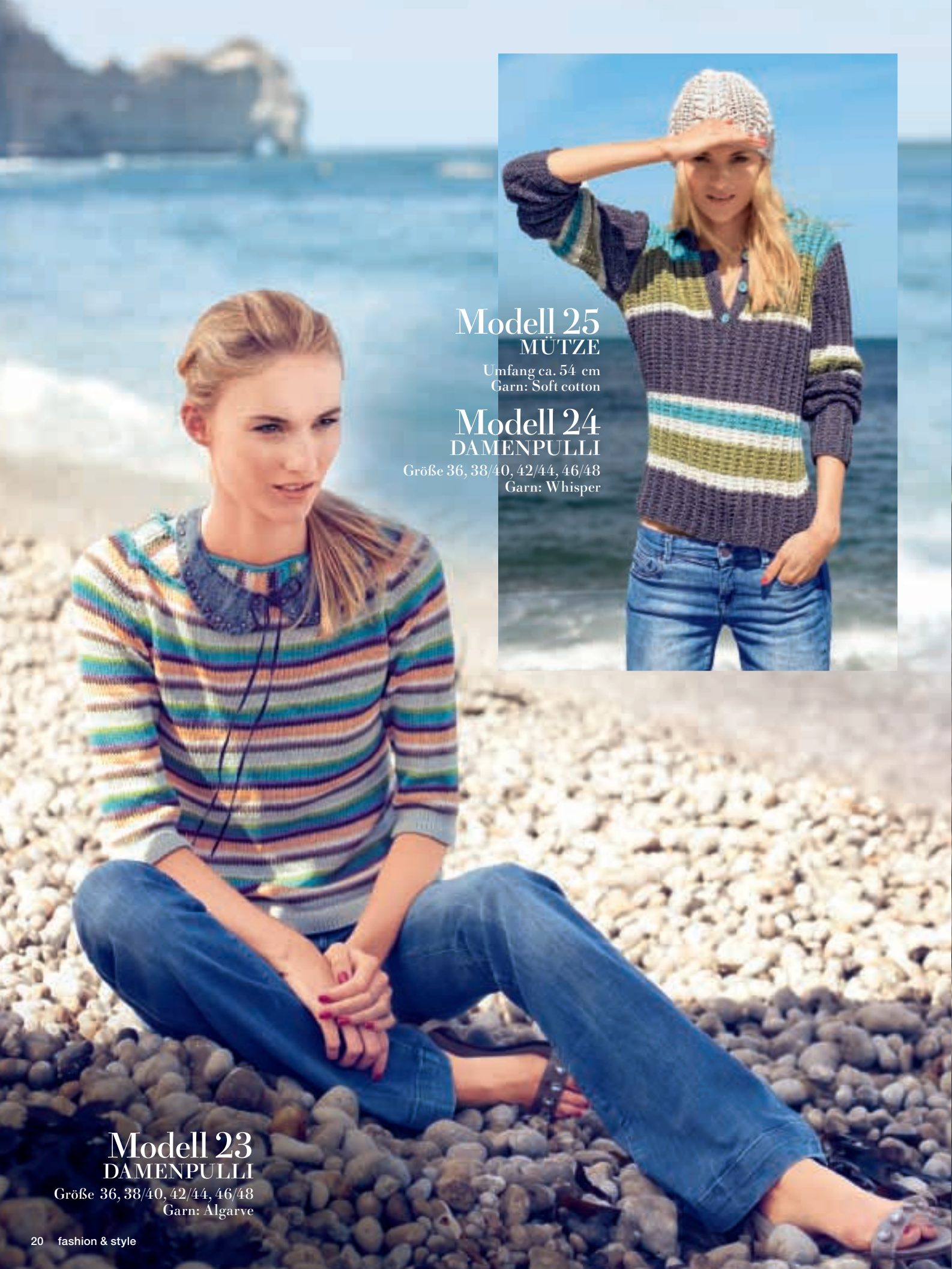
Modell 23 DAMENPULLI Größe 36, 38/40, 42/44, 46/48 Garn: Algarve