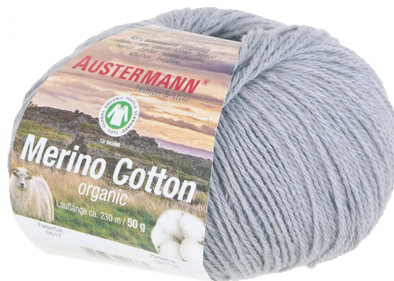
Bild aus Maschen-Style SC 004 Erschienen bei OZ-Verlag Fototeam: Jens-Peter Baser